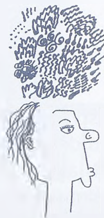
Mozak koji misli i odlučuje

Od male djece doznajemo što misle o pravima. Navodimo prvo primjere iz ranih 90-tih, nastale u okviru talijanskog Reggio Emilia pristupa, izabrane iz knjige 'Put u prava djece'.