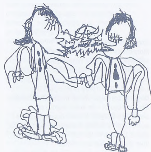
Ljutnja među prijateljima

Pravo je živjeti sretno i živjeti u miru.