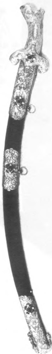
Paradna sablja dr. Milana Amruša posljednja četvrtina 19. stoljeća