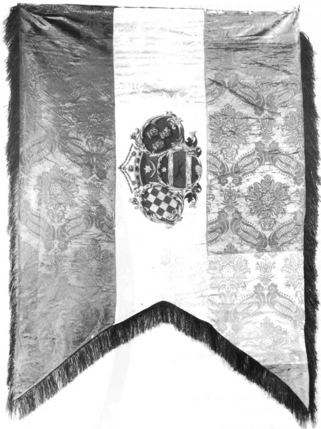
Zastava bana Josipa Šokčevića, Zagreb, 1860. godine trobojni svileni damast, posebne metalne niti