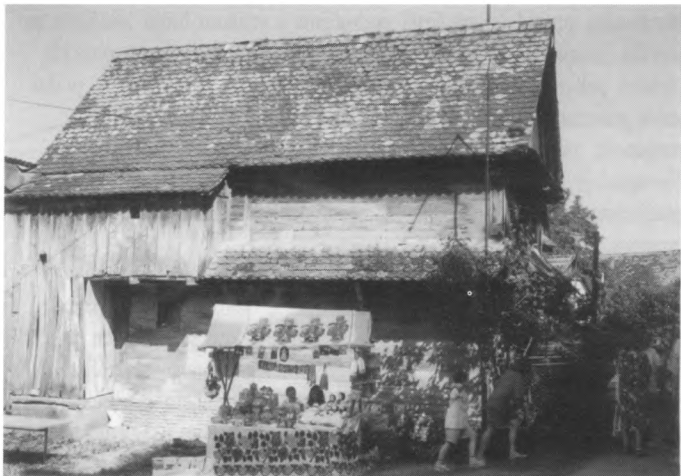
Uz drvene posavske čardake bili su postavljeni štandovi za prodaju posavskih suvenira

hrvatskom i engleskom, a u samom selu informativni pano s planom naselja, rasporedom rodinih gnijezda i pjesmom o Čigoću. Ornitolozi prate broj gnijezda nekoliko godina, a ove su godine ubicirana, popisana i unesena u kartu sva mjesta gdje se nalaze.