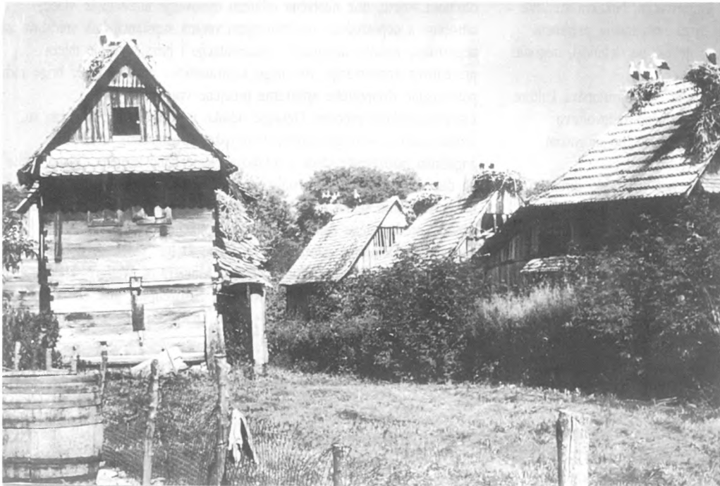
Zaštićena priroda Hrvatske, Čigoć, Europsko selo roda 1994. godine Plakat tiskan povodom dodjele povelje