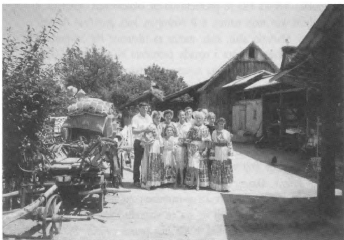
Okućnica obitelji Sučić bila je uređena kao živi muzej, cijela obitelj je bila u narodnim nošnjama

Medijska je prezentacija Lonjskog polja i prije proglašenja Parkom prirode zadovoljavala. Lonjsko polje je bilo prisutno u TV i radio emisijama, vijestima u dnevnom tisku i popularnim člancima. Stručno su prezentirani problemi zaštite i ljepota Lonjskog polja na predavanjima u Hrvatskom ekološkom društvu, izdavanjem plakata i razglednica te tiskanjem knjige vodiča koji su priredili autori Martin Schneider Jacoby i Hartmund Ern. Ove godine medijska pozornost bila je usmjerena na selo Čigoć, koje je dobilo osobito priznanje EURONATUR-a. Naime, zbog koncentracije rodinih gnijezda proglašeno je Europskim selom roda. Dodjela povelje bila je povod za osobitu prezentaciju prirodne i kulturne baštine sela Čigoć.