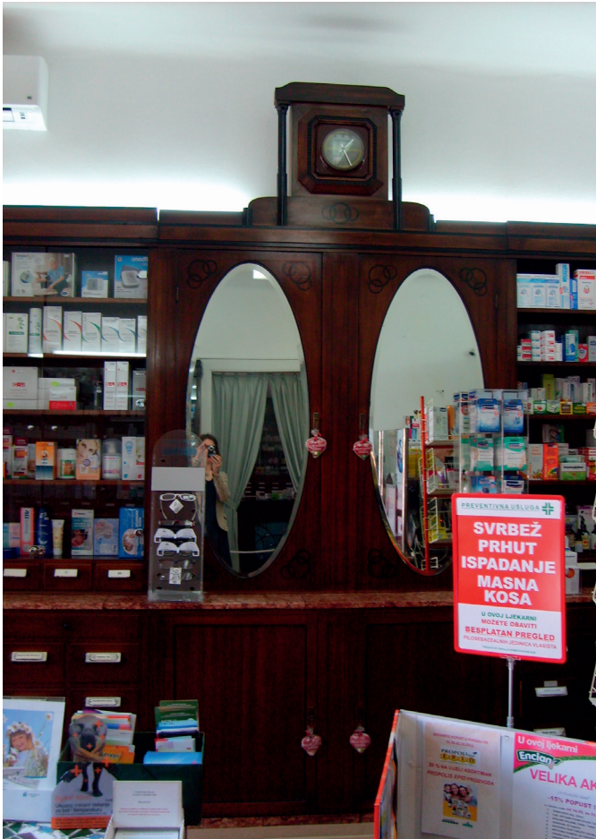
SLIKE 10. I 11. Ljekarnički ormari s elegantnim crnim bordurama kontinuirano se nižu uzduž zidova, s očuvanim natpisima na pojedinim ladicama i tajnim pretincima iza dva ovalna ogledala