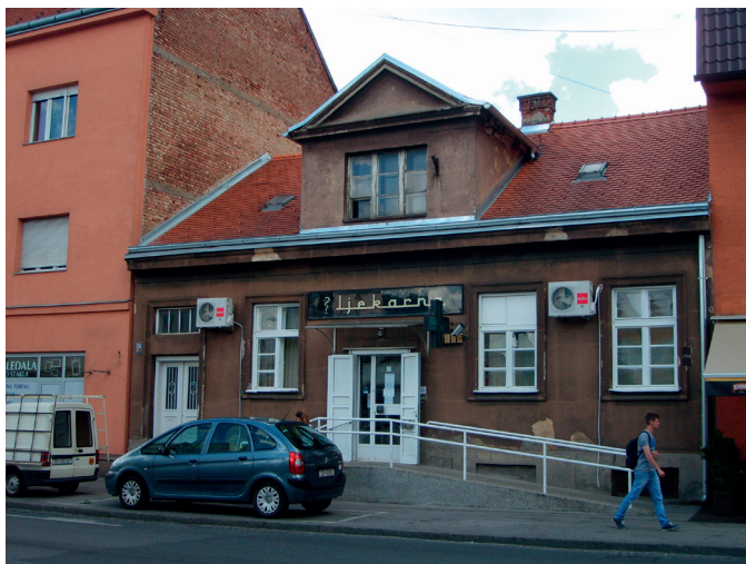
SLIKA 1. Nekadašnja Ljekarna K sv. Antunu, koja danas, kao Gradska Ljekarna, djeluje u prizemlju kuće na adresi Ilica 301