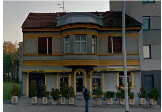
SLIKA 7. Danas se u prizemlju ove zgrade nalazi café-bar Scorpio