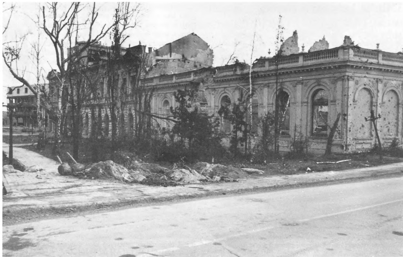
Vukovar 1991. Radnički dom: sjevero-zapadno pročelje nakon razaranja i paljenja

Ne manje važna odredba od ostalih je i definitivno utvrđivanje oblika znaka raspoznavanja, njegove upotrebe itd. 26