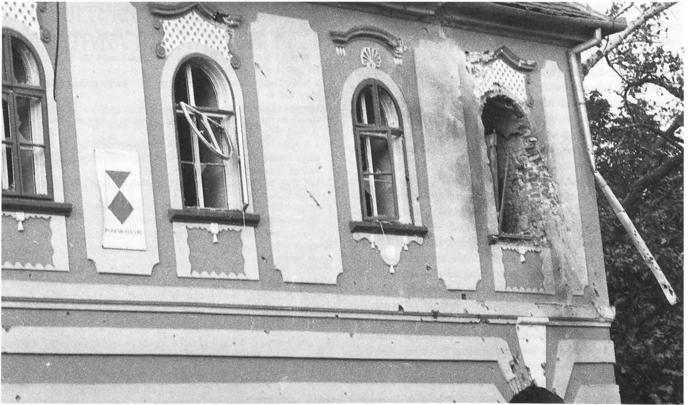
Vinkovci, početak listopada 1991.

Detalj razorenog pročelja zgrade Gradskog muzeja Vinkovaca sa znakom Haaske konvencije