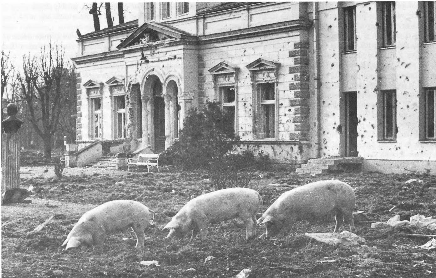
Lipik, 4. 2. 1992. Pogled na dio oštećene zgrade lječilišta

uključivanja jedinica "JNA" ukazalo je nedvojbeno da je u svakoj opsjeci grada ili mjesta jedan od prvih ciljeva bio crkveni toranj ili neki drugi objekt koji je određivao povijesni i kulturni identitet tog mjesta. Taktika kojom su se koristili pri opsjecanju najčešće se zasnivala na dovlačenju artiljerije na već od prije pripremljene i zauzete položaje te bombardiranju civilnih objekata. Obično bez ikakve najave, s potpuno jasnom namjerom da izazovu paniku i bijeg stanovništva uništenjem upravo onih točaka koje su, iako bez ikakve vojne važnosti, od presudnoga psihološkog i identifikacijskog značenja za stanovništvo. Takvo provođenje političke strategije etničkog čišćenja predviđenih teritorija ima za posljedicu da se može sa sigurnošću ustvrditi da je s obzirom na vrijeme trajanja borbi i teritorij njima zahvaćen, broj uništenih kulturnih dobara u ratu u Hrvatskoj, a najvjerojatnije je tako i u Bosni i Hercegovini, najveći u usporedbi s bilo kojim sukobom u povijesti čovječanstva.