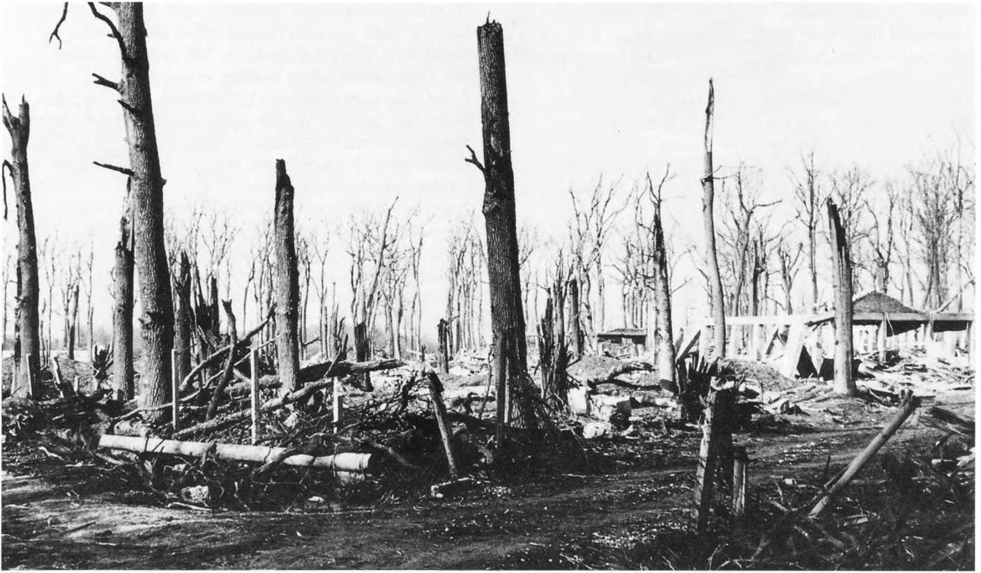
Šuma Bedenik kod Bjelovara, 1991. U eksploziji skladišta streljiva potpuno je uništena stoljetna šuma