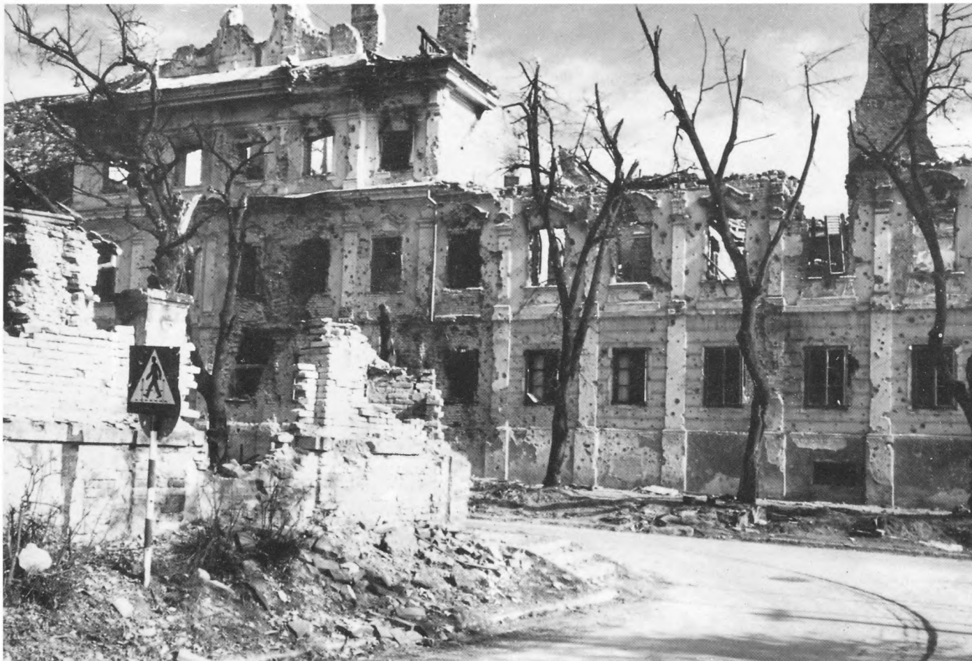
Vukovar, 1991. Dvorac Eltz nakon paljenja i razaranja