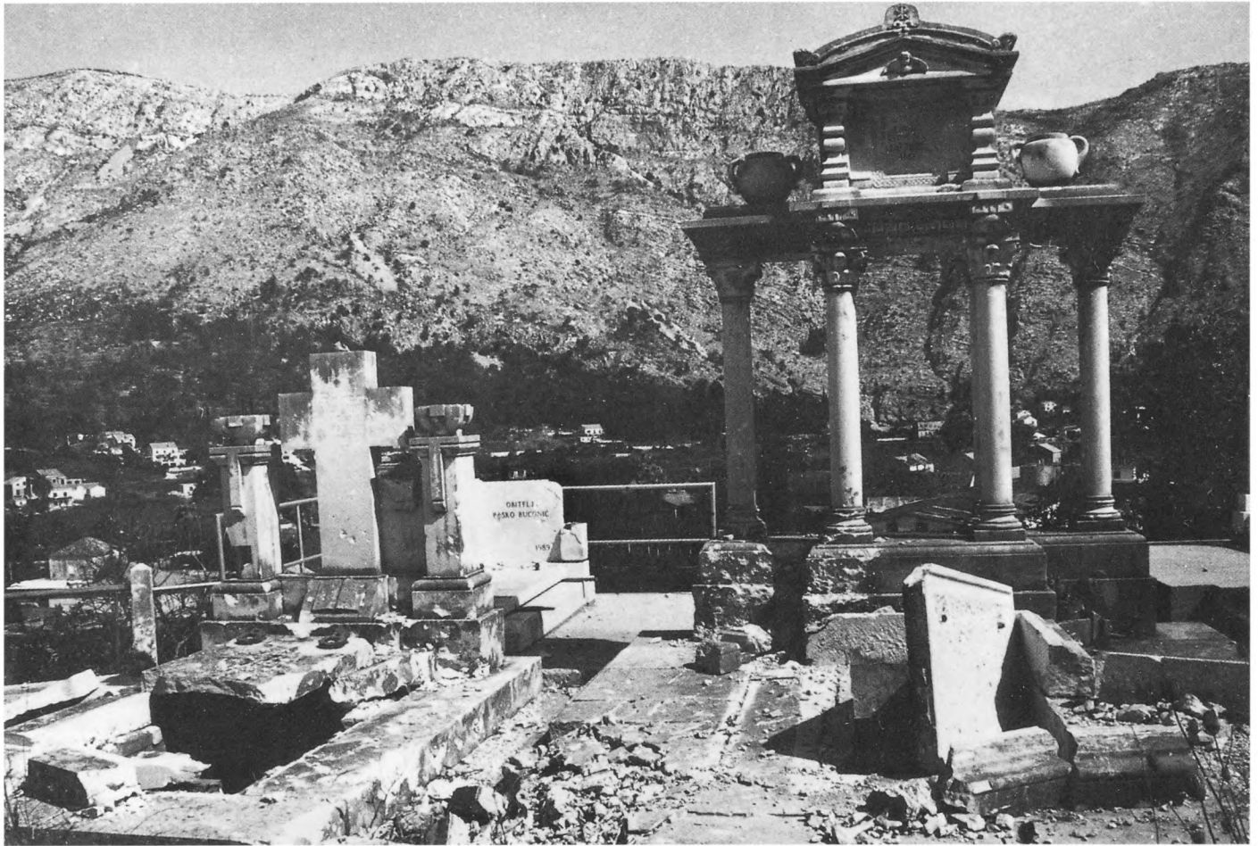
Selo Komolac u Dubrovačkom primorju. Minama uništeno groblje sv. Luke

I prije rata 1991./1992. godine u Hrvatskoj su, samo za razdoblje od 1981. do 1987. godine, podnesene 492 krivične prijave krađa umjetnina, od kojih je 231 slučaj rasvijetljen. Najčešće su na meti krađa bile crkve na osami, pokadšto i izvan funkcije, napuštene palače, dubine jadranskog podmorja - sačuvanoga sredozemnog podmorskog muzeja, brojni arheološki lokaliteti i etnološka grada.