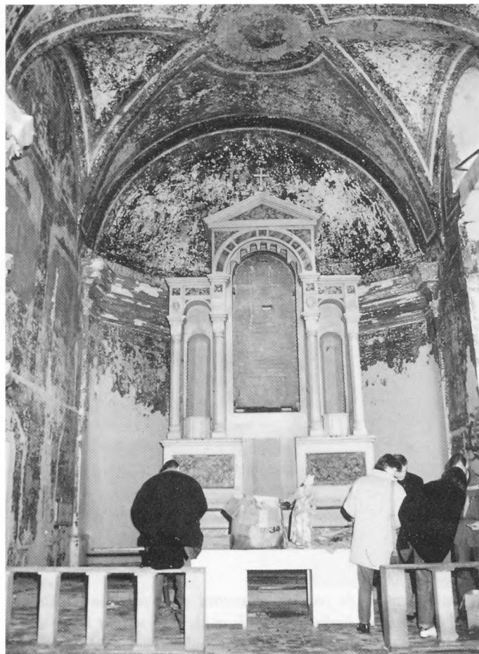
Bavorska delegacija u obilasku katoličke crkve u Gospiću

Bavorska delegacija svoj je boravak u Hrvatskoj završila u Zagrebu u