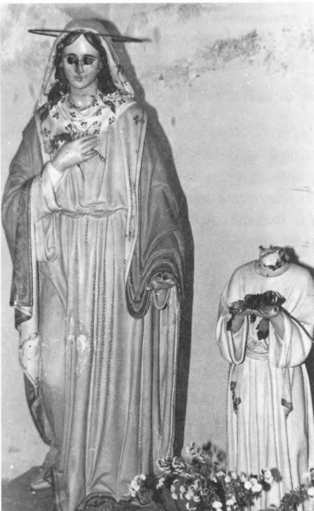
Čilipi, prosinca 1992.

The Bavarian side expressed their readiness to assist in the adaptation of one of the Croatian castles for the purposes of restoration and sheltering evacuated works of art. They proposed to donate the equipment for the workshops, and to give practical expert assistance in the restoration of works of art combined with the training for young restorers.