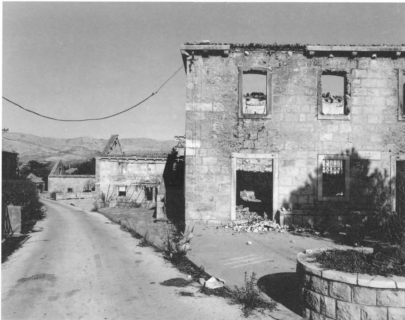
Spaljeni i razoreni Zavičajni muzej Čilipa, studeni 1992.

moći i morati bilježiti ratno i poratno vrijeme.