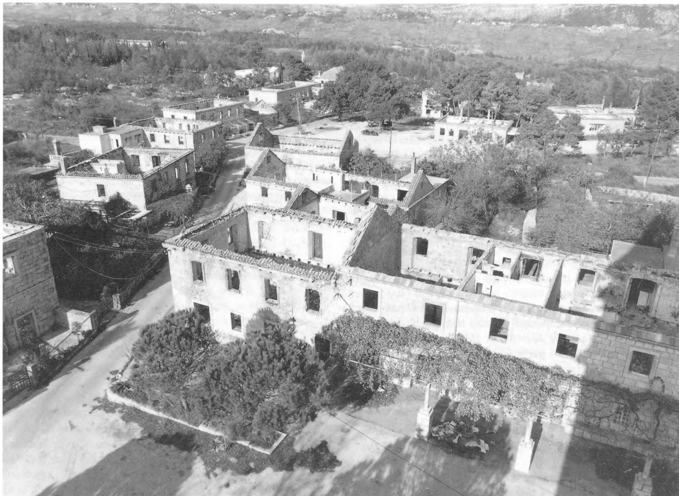
Razoreni Čilipi, studeni 1992.