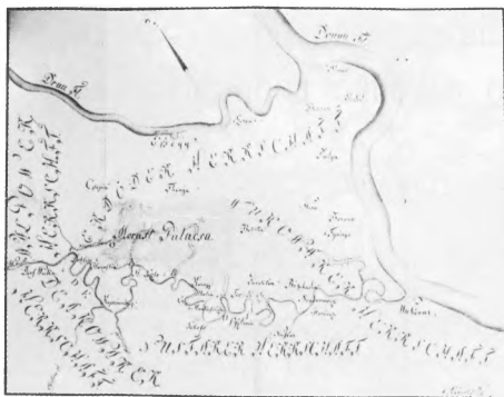
Karta veleposjeda iz 18. stoljeća

“evropske konfekcije”. To je značilo daljnju destrukciju naslijeđenih vrijednosti hrvatskog sela, njegove izvorne slike i lika. Nestaje povijesni i duhovni ambijent, nestaje zavičaj... Uza sve to, do ovog rata sačuvano je u povijesnom dijelu Nuštra 80-ak tradicijskih slavonskih kuća. U ovom ratu u Nuštru gotovo da nema neoštećene kuće, a velik dio je potpuno uništen. Ako u Nuštru nestane i onaj broj do rata sačuvanih tradicijskih kuća, Nuštar može postati provincijsko, bezlično prigradsko naselje Vinkovaca. Da se to ne dogodi, u povijesnom dijelu naselja, gdje god je moguće, treba rekonstruirati tradicijsku kuću, a gdje ne, graditi suvremenu kuću na tragu tradicije...” (Z. Živković, 1992.).