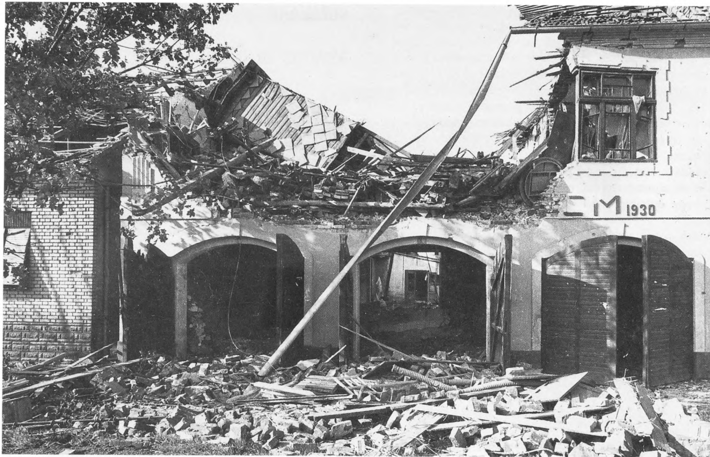
Nuštar, početkom listopada 1991. Pogled na razoreno pročelje crkve Duha Svetog