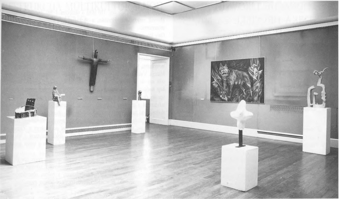
Postav prve izložbe donacija likovnih umjetnika Muzeju Vukovar u progonstvu, veljača 1993., Muzeju Mimaru Zagreb Fototeka Muzejsko-galerijskog centra, Zagreb