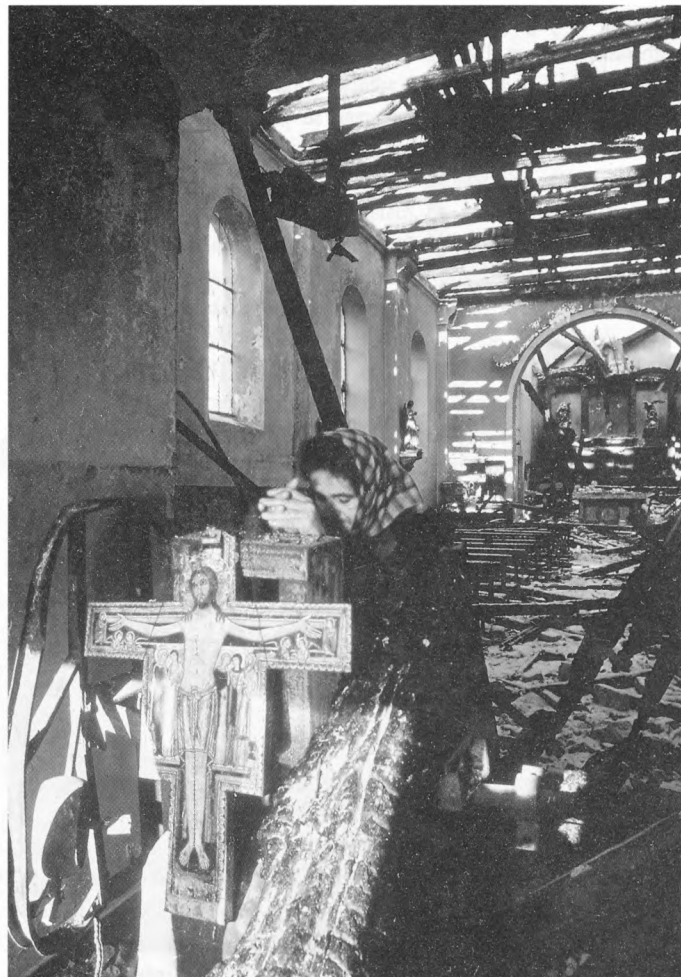
Razorena katolička crkva na Stupu kraj Sarajeva, 1992.