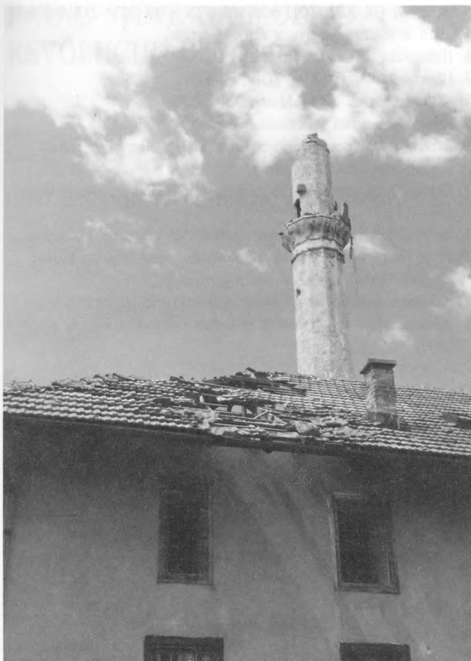
Srušena džamija na Kovačima, Sarajevo, 1992.

buildings in the city center, designed at the turn of the century by famous architects, are either destroyed or badly damaged.