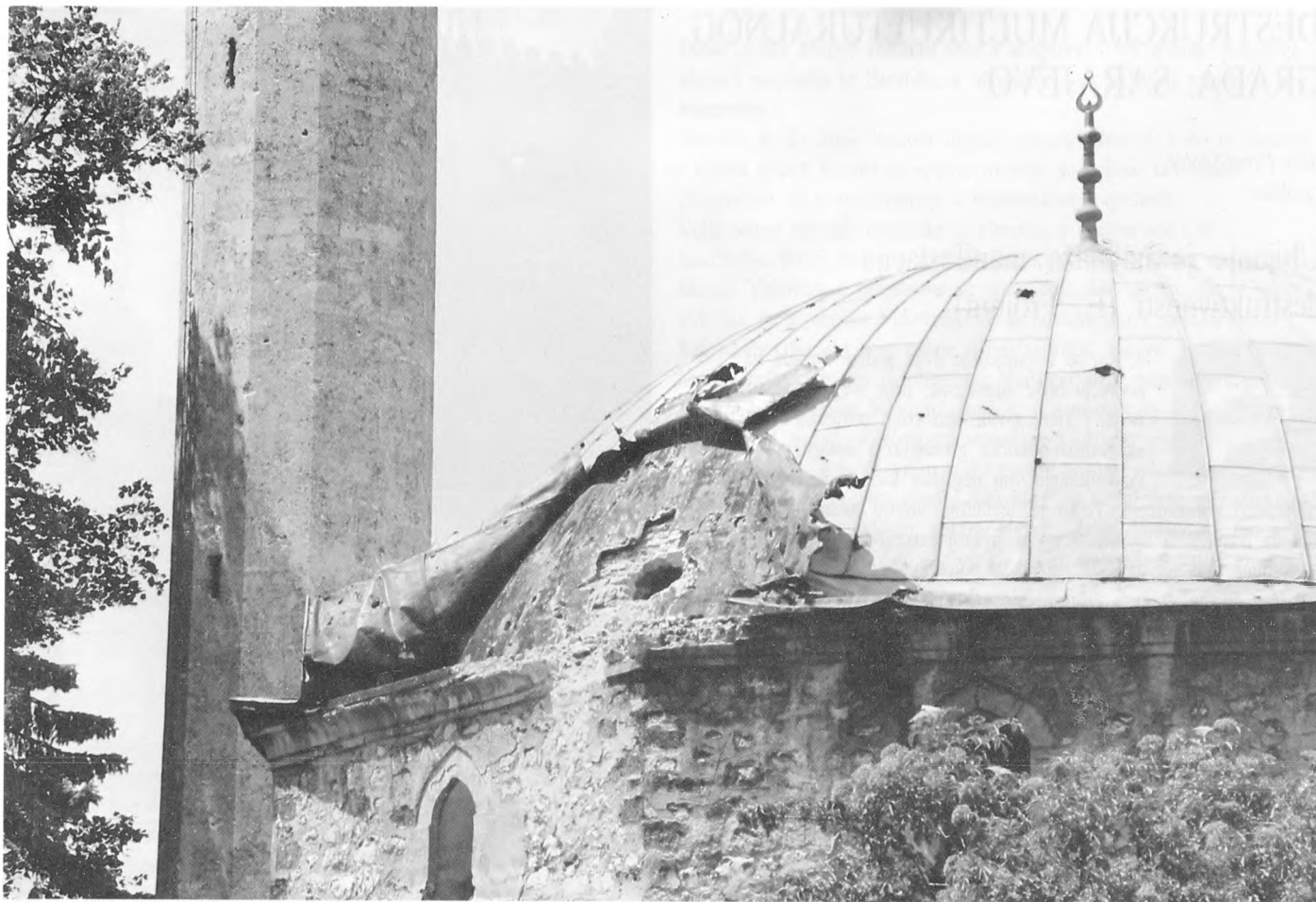
Pogodena Alipašina džamija u Sarajevu, 1992.

vjerske zajednice BiH, kraj rujna 1992.).