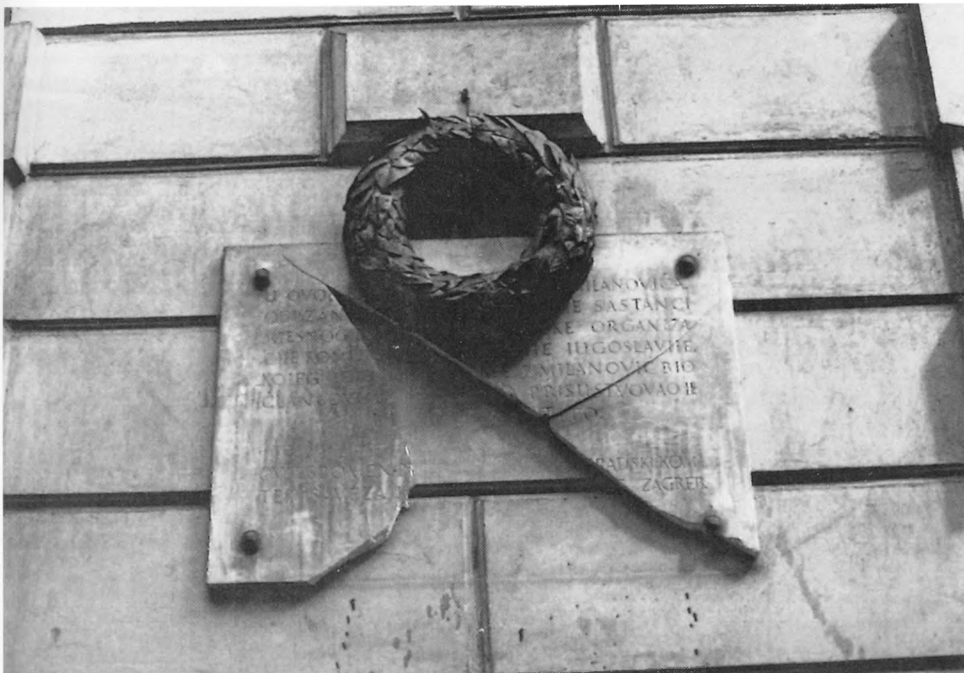
Oštećena spomen ploča u Deželićevoj ulici u Zagrebu