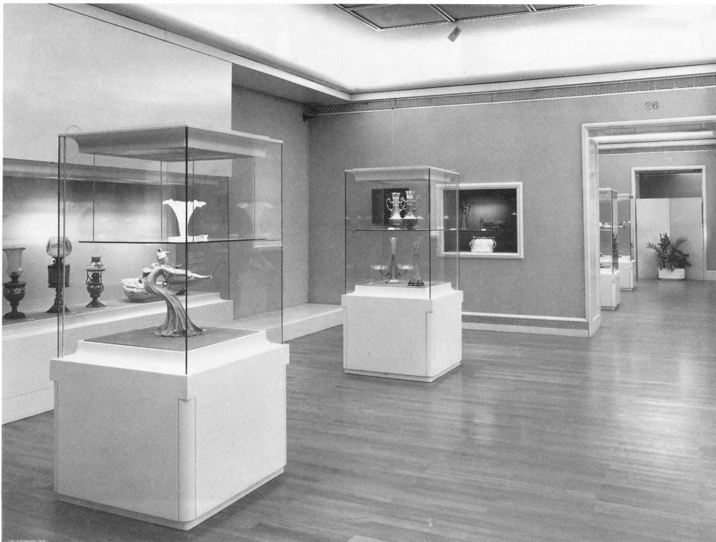
Secesijske umjetnine iz zbirke dr. Kajfeža na izložbi Zagrebački kolekcionari, Muzej Mimara, Zagreb