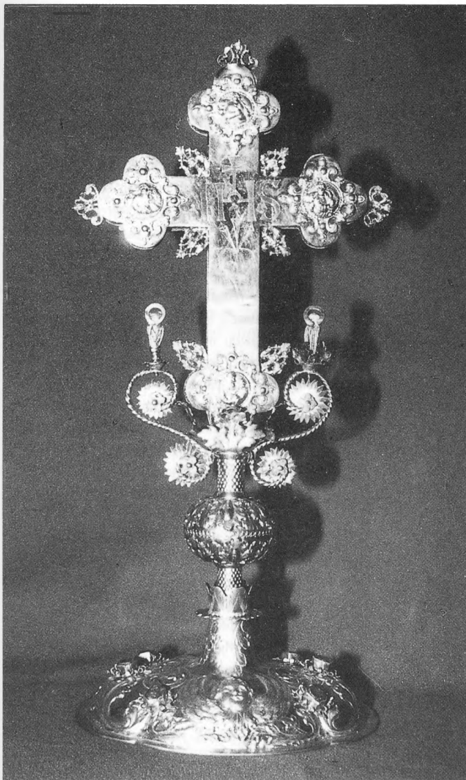
Pacifikal, pozlačeno srebro, 17. stoljeće iz crkve sv. Marije Magdalene u Bisogu, sa izložbe Crkvena umjetnost i baština Novomarofskog kraja

The exhibition entitled "The Ecclesiastical Art and Heritage of Novi Marof Region" is composed of 150 pieces: paintings, statues, vestments, documents, and books. The exhibition is a part of the effort of its organizer, Matica Hrvatska, to document and present the ecclesiastical heritage of the Novi Marof Region, which has been almost unknown even to the expert public.