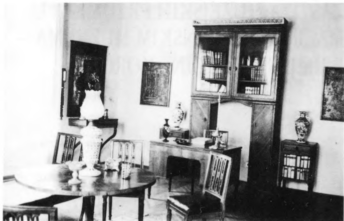
Kulturno-umjetnička zbirka Muzeja Korčule

1. Muzej Korčule u Korčuli uređen je i otvoren 1957. godine u velikoj renesansnoj palači Gabrielis u središtu stare jezgre. Posjeduje više od tisuću predmeta, nekoliko cjelovitih zbirki, arhivsku građu i dr. Zgrada je tada skromno uređena i opremljena najnužnijim pomagalicama (vitrine). Nekoliko godina o muzeju brine općina Korčula, od 1965. do 1977.