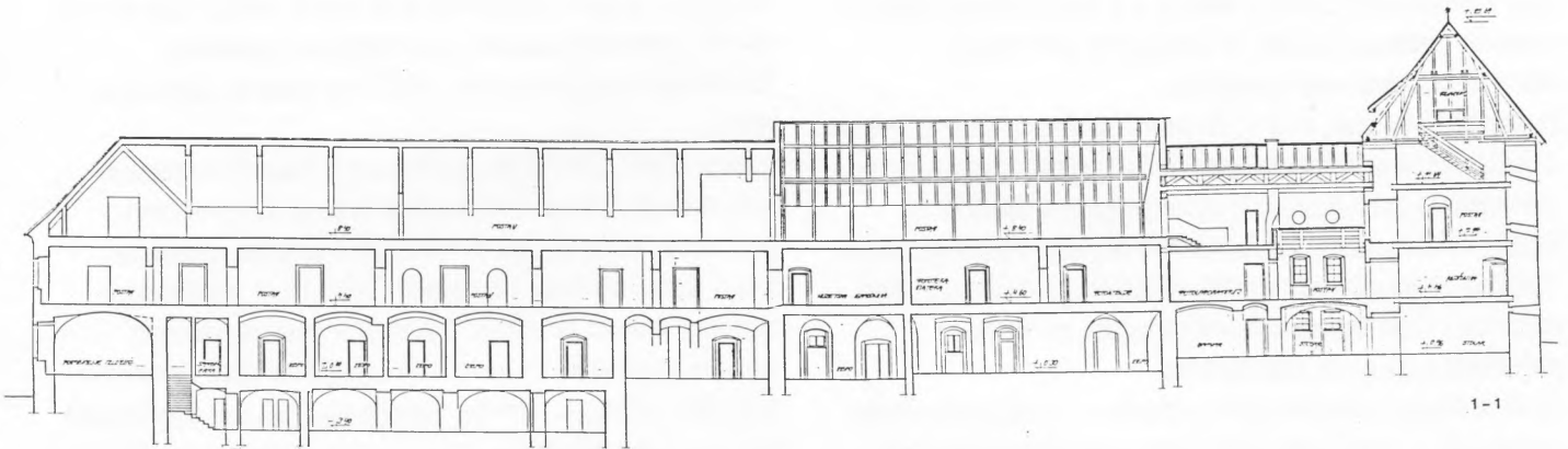
Idejni projekt obnove Muzeja grada Zagreba – presjek; izradio Arhitektonski biro „Centar 51“, Zagreb