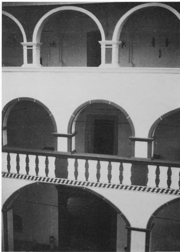
Unutrašnje dvorište obnovljene starogradske tvrđave s oslikanim detaljima