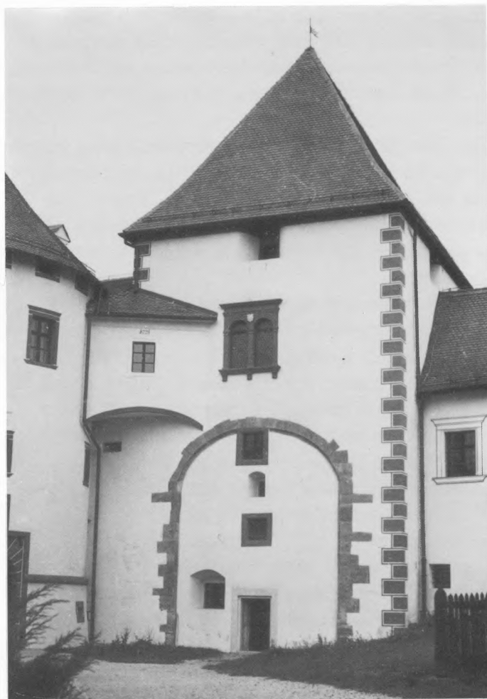
Obnovljena starogradska tvrđava u kojoj je smješten Gradski muzej Varaždin

U istom gotičkom tornju bili su u prostoriji na prvom katu vidljivi dijelovi visokoga šiljatog luka nekadašnjega glavnog ulaza u tvrđavu. Njima je nedostajao vršni dio, pa je on u obnovi rekonstruiran. Pod prostorije je na tome mjestu otvoren da bi se bolje vidjeli profili