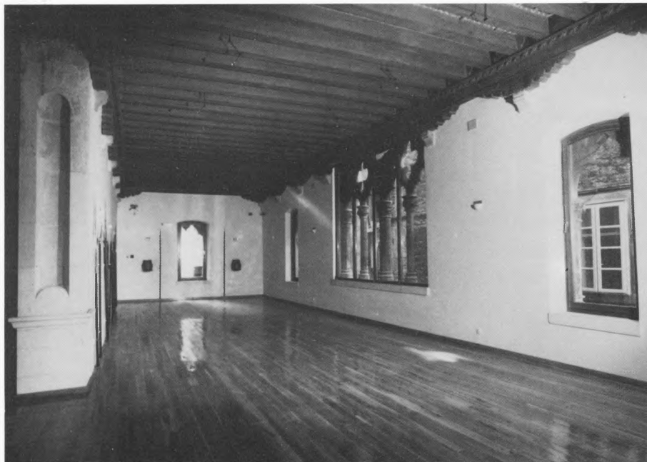
Muzej grada Splita – dvorana na prvom katu dvorišne zgrade s obnovljenim terazzo podom