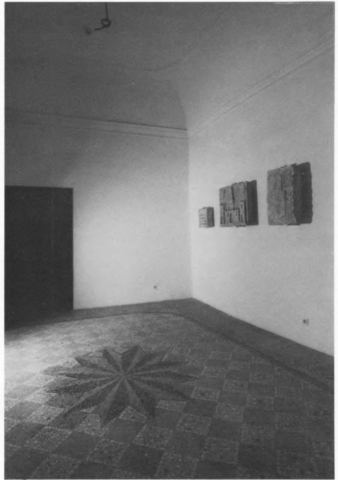
Muzej grada Splita – dvorana na prvom katu Papalićeve palače nakon obnove; snimio: Zvonimir Buljević

Karakter postava uvjetovan je raspoloživom muzejskom građom. Kao što je uobičajeno u postavi gradskih muzeja, slijedio se princip kronološkog izlaganja, a to znači povijesni slijed od prapovijesti do najnovijih dana. Raspoloživi prostor uvjetovao je raspored građe. Svaki kat, svaka dvorana na katovima oblikuje se kao posebna razvojna cjelina. U ovoj koncepciji, s obzirom na spomeničku vrijednost same Papalićeve palače, glavni