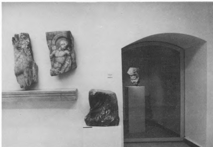
Pogled na arheološki dio Zbirke Benediktinskog samostana u Trogiru

The monastery of the Benedictine nuns in Trogir was founded in 1064. It contains a collection of objects belonging to the valuable historical and art heritage from the 13 th century onwards. The Collection of the Benedictine Monastery was expanded and renovated in 1990. The authors of the permanent display are the architects Radoslav Bužančić and Vanja Kovačević. The permanent display has been housed on the ground floor of the monastery complex, exhibiting archaeological material, a small collection of stone, monastery inventory and Dalmatian paintings from the 15 th century, Italo-Cretan icons, Venetian painting from the 17 th to the 19 th century, silverware, embroidery, lace, manuscripts and books. A systematic restoration of works of art has also been planned.