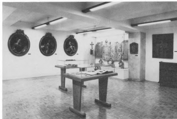
Stalni postav Zbirke Benediktinskog samostana u Trogiru