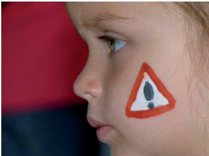
Fotografirano u Obiteljskom centru 'Das Menschenkinderkulturkunsthauus' u Nettetalu

Njemačka: Projekt Obiteljski centri nje-mačke savezne pokrajine Sjeverna Rajna - Vestfalija predstavilo je Sveučilište Duisburg-Essen 4 . Strateška inicijativa savezne vlade da razviju svojih 9.000 vrtića u 'certificirane' obiteljske centre (s jamstvom kvalitete usluga) treba poslužiti kao 'krovna' mreža lokalnih obiteljskih i dječjih centara, sa zadaćom poboljšavanja roditeljskih vještina i znanja, te pomoć u usklađenju radnog i obiteljskog života i okruženja.