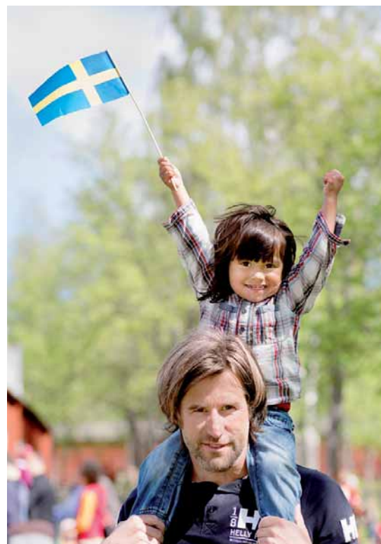
Fotografija odražava naš prošli i budući rad u području roditeljstva, a odnosi se na podršku očevima u roditeljskoj ulozi