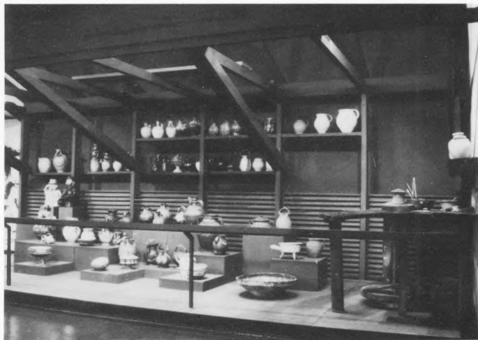
Etnografski muzej, Beograd – detalj stalnog postava: grnčarska radionica, Pirot, jugoistočna Srbija; iz fototeke Etnografskog muzeja

porekla i sastava stanovništva, dijalektoloških osobina, privrednih karakteristika, načina stanovanja, odevanja, nekih izrazitih oblika društvene organizacije, guhovne nadgradnje, narodni život i kultura u Srbiji prikazani su u okviru sledećih kulturnih zona: 1. dinarsko područje jugozapadne Srbije, 2. Kosovo i Pomoravlje južne Morave, 3. Šopluk i severoistočna Srbija, 4. prelazna oblast severne Srbije i Vojvodina.