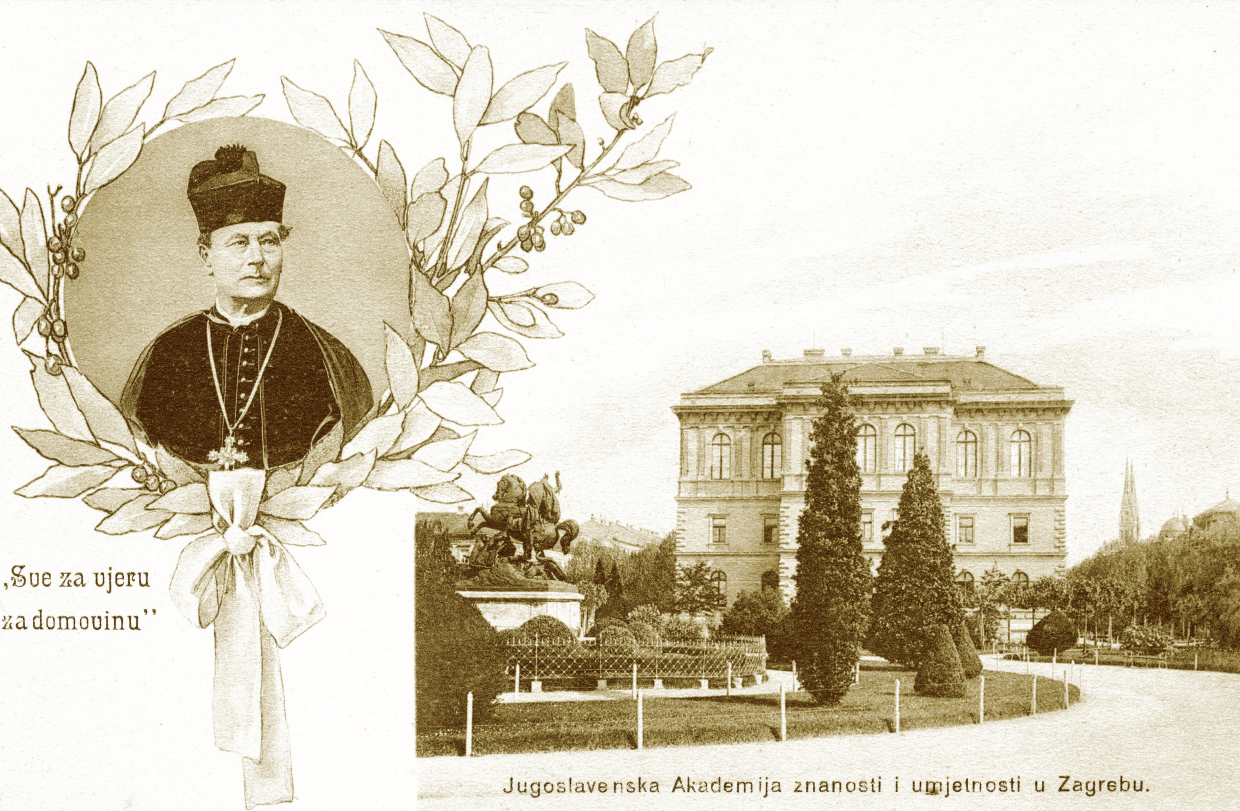
Jugoslavenska Akademija znanosti i umjetnosti u Zagrebu.