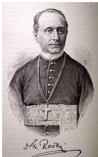
Dr. Franjo Rački, prvi predsjednik HAZU, hrvatski povjesničar, veliki Strossmayerov suradnik

koji je izlazio do 1866. Uređivali su ga Franjo Rački, Josip Torbar i Vatroslav Jagić. Znanstveni prilozi najčešće su iz filologije i povijesti, kadšto i iz prirodnih znanosti. U tri godine objavljena je 1821 stranica i općenito se drži da taj časopis znači prekid sa znanstvenim diletantizmom u Hrvatskoj. Iz njega je proizašao Rad Jugoslavenske akademije znanosti i umjetnosti koji je 1867. počeo izlaziti kao povremenik, a poslije prerastao u zbornik u kome objavljuju svoje radove članovi svih triju tadašnjih razreda. Od 1883. počinje svaki razred objavljivati svoju zasebnu seriju i povećanjem broja razreda povećavao se i broj serija. Dosad je izašlo preko 500 knjiga s više od 3000 važnih priloga iz različitih znanosti. Slijedile su i brojne druge edicije, npr. Monumenta spectantia historiam Sllavorum meridionalium (od 1868.), Starine (od 1869.), Stari pisci hrvatski (od 1869.) i druge. No nisu se samo održavale stare edicije nego su zaživjela nova izdanja u skladu s potrebama vremena: spominjem samo seriju opsežnih, temeljito pisanih i izvanredno likovno opremljenih knjiga u seriji Hrvatska i Europa , koje se, osim na hrvatskom, pripremaju na engleskom i francuskom jeziku.