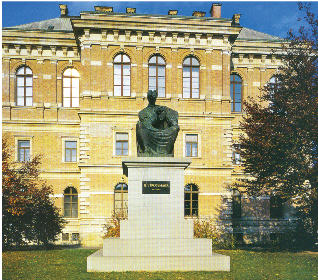
Biskup J. J. Strossmayer i njegovo djelo. Današnja palača HAZU Zagreb

baš zato zaslužuje, što mu mramora ne treba... Veliki je književnik i rodoljub stalno naglašavao kako Biskup ... bijaše tako kulturnan čovjek, da vjerovaše, usprkos primjerima povijesnim i savremenim, u apsolutnu moć prosvjete, zamjenjujući je s narodnom politikom.