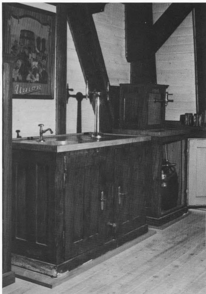
Pivovarski muzej, Ljubljana – pult za točenje piva; snimio: A. Vanelli