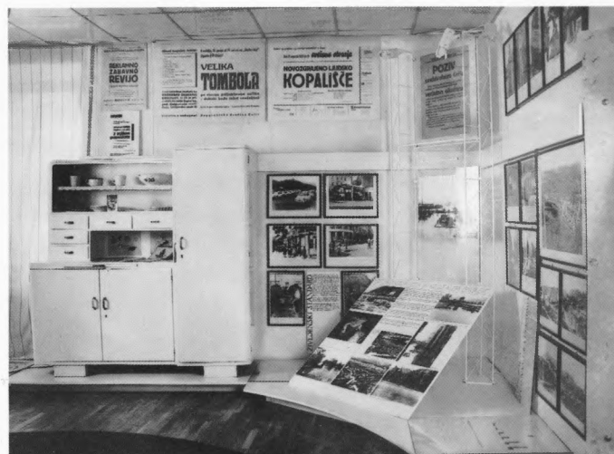
Muzej revolucije, Celje – detalj postava II razdoblja (1950 – 1963)