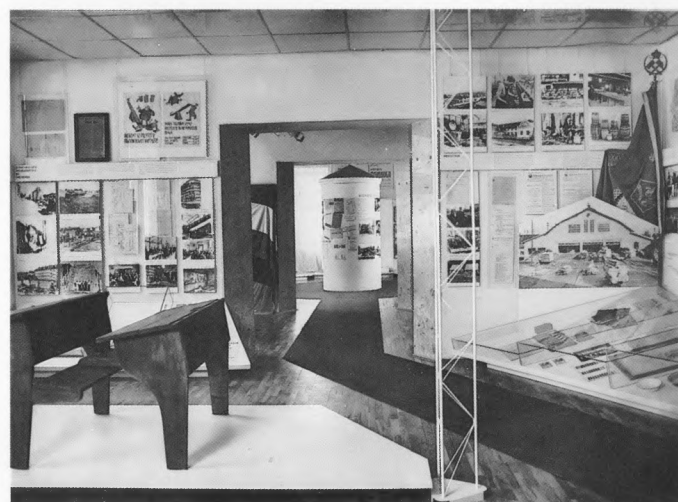
Muzej revolucije, Celje – detalj postava I razdoblja (1945 – 1950)

Razdoblje 1945–1950. predstavljeno je sljedećim temama: zadnji dani rata, obnova i društveno politički život nakon oslobođenja, osnivanje mreže osnovnog i srednjeg školstva, nestašica stanova i opskrba – dva osnovna problema grada, polaganje temelja socijalističke privrede i prva petoljetka, crveni kutić, procvat narodnog prosvjetiteljstva i fiskulture u slobodi.