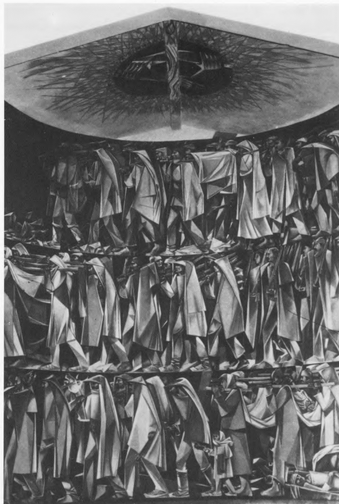
Istorijski muzej, Kruševo – detalj postava: freska Borka Lazevskog, 1988.

Izradi stalnog postava pristupilo se etapno, po znanstvenim disciplinama koje konstituiraju muzej, arheologiji, povijesti i etnologiji. Najprije je realiziran stalni postav arheološkog odjela, 1982. godine. 3 Na prostoru koji obuhvaća oko 1000 četvornih metara izložena je arheološka baština tematski povezujući razdoblje od prehistorije do dolaska Slavena, a geografski, prostor Makedonije s većim akcentom na skopskoj regiji. Slijedeći već ustaljenu shemu klasičnih postava koji poštuju prostorno-vremensku određenost, stalni postav arheološke zbirke ima više sekvenca edukativnoga karaktera (u kojima se npr. objašnjava funkcija predmeta) i vrlo uspješni postav antičke skulpture, gdje se