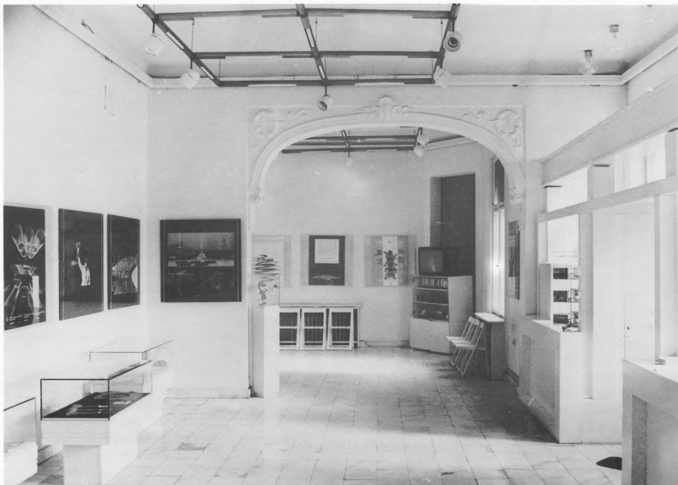
Muzej XIV ZOI, Sarajevo – detalj stalnog postava

Idejni projekt je, uz osnovnu stručnu sadržajnu i konceptijsku preporuku iz Muzeja, pripremio uspješni sarajevski tandem arhitekata Tanja Dimitrijević-Roš i Stjepan Roš (učesće na konkursu za Muzej revolucije u Ljubljani, otkupna nagrada na konkursu za arhitektonsko-urbanističko rješenje Rapca i Grand prix Collegiuma Artisticuma u Sarajevu za realizaciju adaptacije Kamernog teatra 55). Poznavajući svjetske muzejske postavke i njihovu problematiku, iskustva savremene arhitekture, likovnu i pozorišnu umjetnost, rado su se prihvatili ponudenoga zadatka shvativši ga kao neke vrste profesionalnoga kreativnog izazova. Novo arhitektonsko rješenje bazirano je na postmodernističkom shvaćanju prostora i dijalektičkom odnosu prema sadržaju-zbirici stvarajući kreativnu komunikacijsku atmosferu. Smanjen i prilagođen novom duhu izložbe, dokumentarno-informativni aparat poštuje osnovne muzeološke zahtjeve. Nadgrađen je jakom videoinformacijom i dijainformacijom. Olimpijski duh, entuzijazam, vedrina mladosti i iskustvo tradicije, kreativnost – to su poruke koje bi novi postav trebao emitirati svakom posjetiocu muzeja, koji je naglašenim simbolima, prikrivenom informacijom i novoosmišljenom prostornom dimenzijom nehotice uključen u neke vrste muzejske scenografije gdje je prisiljen aktivno učestvovati u percepciji muzejskog materijala, istraživati prostor i definirati vlastitu hodnu liniju.