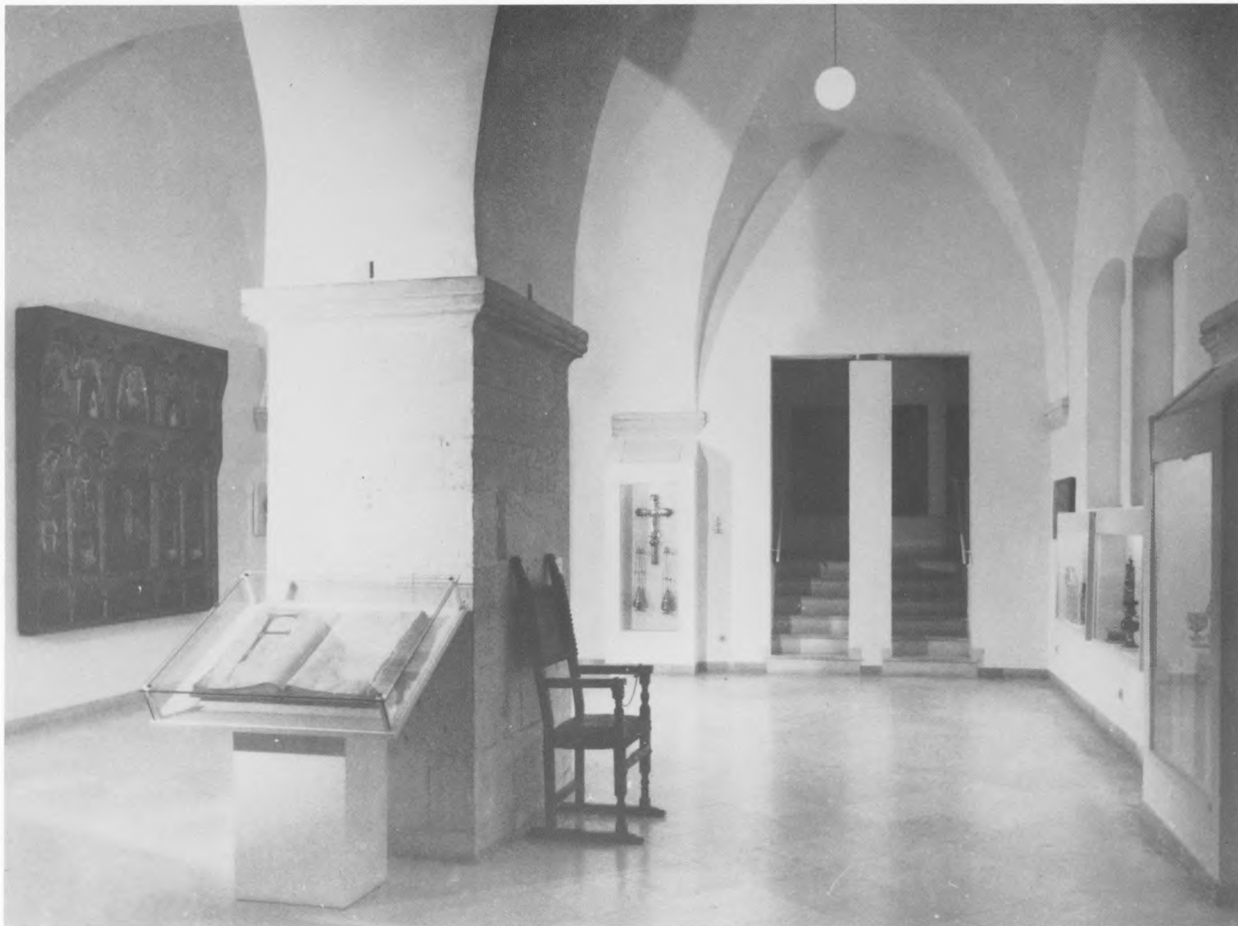
Detalj postava Muzeja Dominikanskog samostana, Dubrovnik

sporedni je prostor podignut na razinu izlagačkoga. Bijeli zidovi kao pozadina, dovoljno prozračnosti između eksponata, diskretne zidne vitrine čine postav preglednim. Osvjetljenje prostora kombinacijom prirodnog i umjetnog svjetla je optimalno. U ovom ambijentu arh. Prtenjak je proveo svoj princip da se povijesni prostori osvjetljavaju običnim žaruljama, nikakvim reflektorima, spotovima, halogenim svjetlima, što je i ljudskom oku ugodnije i manje šteti izloženom materijalu i čime se izbjegava komplicirana električna instalacija koja remeti estetiku prostora. Žarulje su skrivene iza diskretnih, bijelih kutnih paravana. Uopće, skromnim sredstvima i mobilijarom, uvjetovanim ograničenim financijskim mogućnostima, autor postava je postigao optimalna muzeološka rješenja. Uz dominikansku crkvu, čiji je interijer preuređen 1989. također po projektu Ivana Prtenjaka, dobivena je uspješna cjelina muzejsko-crkvenoga kompleksa. U planu je i uređenje galerije suvremene umjetnosti unutar Dominikanskog samostana.