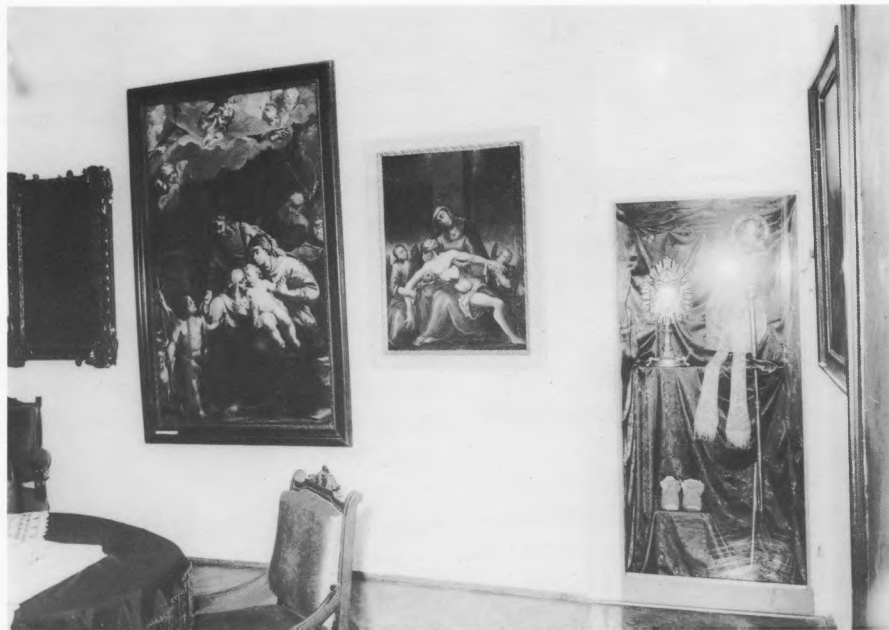
Sakralna zbirka Franjevačkog samostana, Osijek – detalj postava