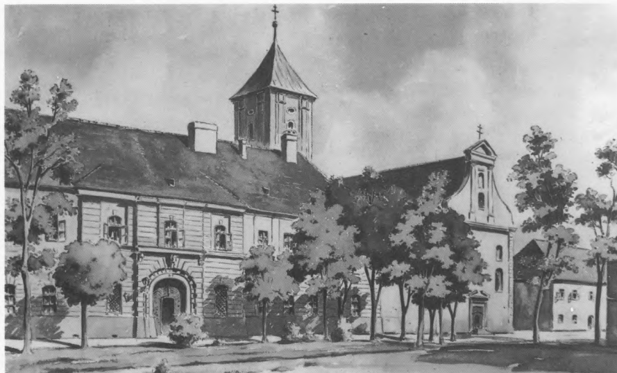
Sakralna zbirka Franjevačkog samostana, Osijek – akvarel Ivana Rocha, 1939, Franjevački samostan i crkva u Tvrdi (zdanje u kojem je danas smještena zbirka)

Prva soba – Upravo je najviše problema bilo kako osmisliti prvu sobu jer smo željeli da se vidi od svega što ima u samostanu.