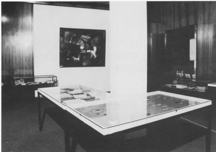
Detalj s izložbe Doba francuske uprave u Dalmaciji u Muzeju narodne revolucije, Split

The anniversary of the Zagreb Fair was commemorated by an exhibition of stamps, and an issue of stamps and envelopes, as a special type of marketing for the Fair.