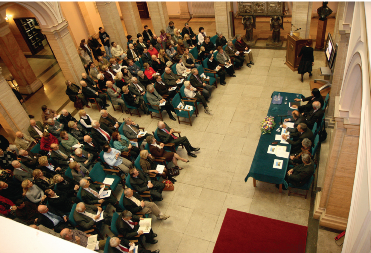
Uzvanici i radno predsjedništvo na promociji knjige. 23. studenoga 2011., Zagreb Atrij Hrvatske akademije znanosti i umjetnosti

talna narkoza. Grad Osijek tako se i po svojim zdravstvenim uslugama približio susjednim medicinskim centrima pa, kako i sam Florschütz navodi, Nije više bilo potrebno da se radi operacije putuje u Zagreb, Pečuh, dapače u Budimpeštu, Beč ili Graz, jer su se gotovo sve operacije mogle obaviti u Osijeku.