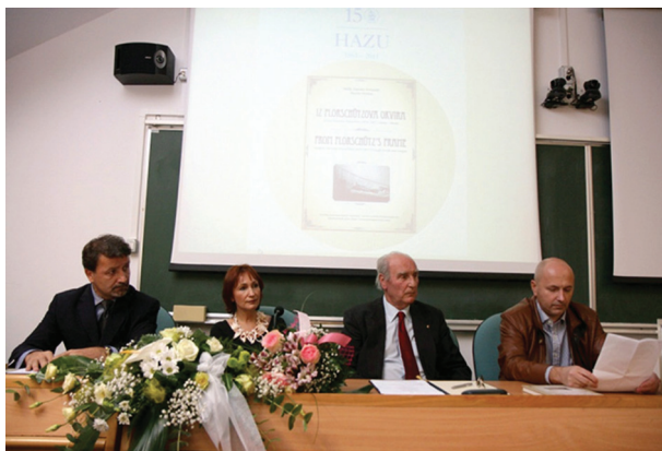
Radno predsjedništvo. 9. studenoga 2011. Medicinski fakultet Sveučilišta u Osijeku