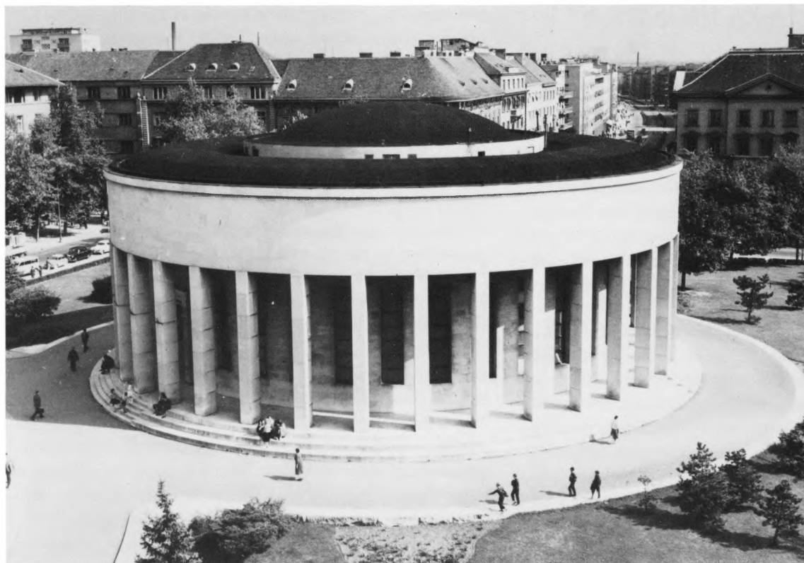
Muzej revolucije naroda Hrvatske, Zagreb; projekt: Ivan Meštrović

struktura postavljena kronološki s time da su u taj niz ukomponirane relativno nezavisne podteme koje bi se s vremena na vrijeme mijenjale. Uzmimo za primjer tisak, temu koja prije nego što bi se zamijenila nekom drugom može »prošetati« kroz sve četiri cjeline postava jer tisak i jest prisutan u sva četiri dijela. To se ne može, naprimjer, dogoditi s podtemom sanitet u ratu iz razumljivih razloga.