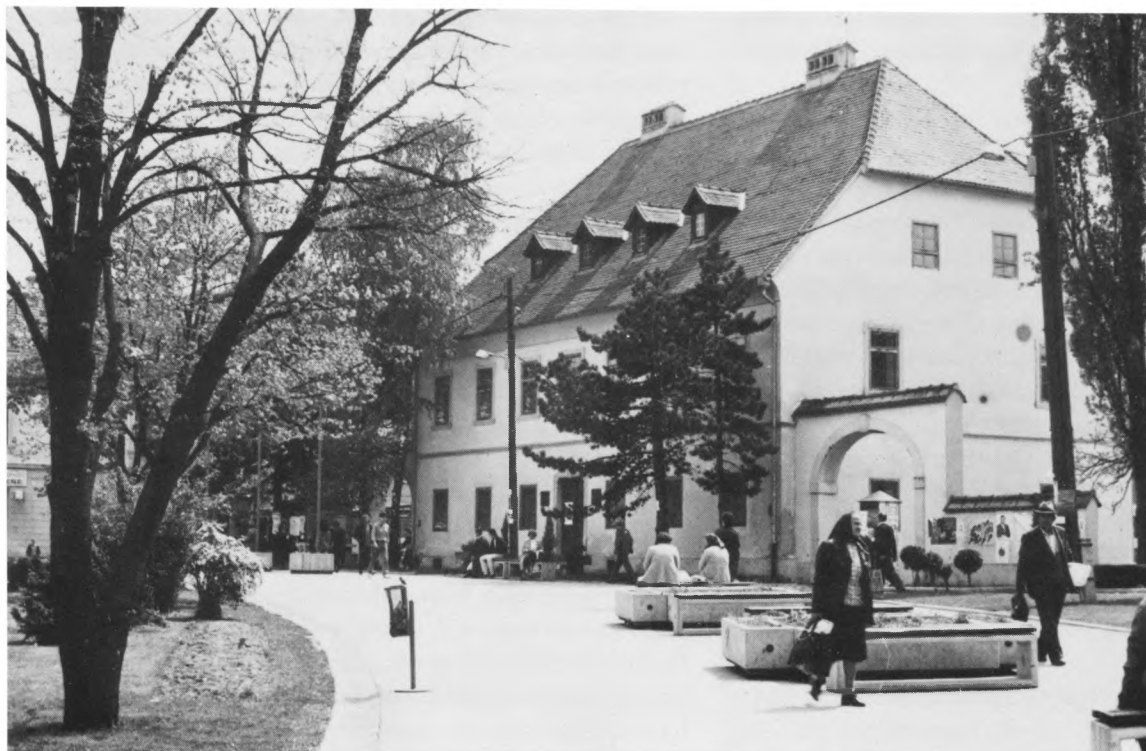
Muzej Prigorja, Sesvete – izgled zgrade; snimio: M. Tomljenović

Desetogodišnja opsežna terenska istraživanja narodnoga graditeljstva Prigorja rezultirala su sa do sada istražene gotovo \frac{3}{4} područja djelovanja Muzeja. Metodološki je obrađeno gotovo 2000 čvrstih uglavnom drvenih objekata, uz fotodokumentaciju oko 5500 negativa i dijapozitiva. Također, izvršene su brojne akcije prikupljanja i otkupa etnografskog i povijesnog materijala na terenu, te preuzimanje nekoliko manjih i većih fundusa arhivske i fotografske. Ulaskom općine Sesvete u Gradsku zajednicu općina Zagreba 1982/83. godine, uz sada izravno financiranje USIZ-a kulture grada, naš se razvoj ubrzaniije