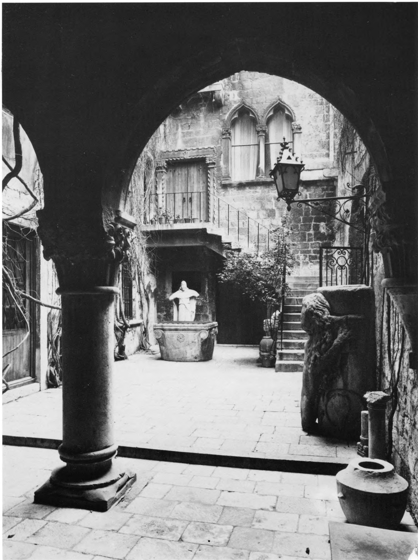
Muzej grada Splita – detalj dvorišta Papalićeve palače prije sanacije