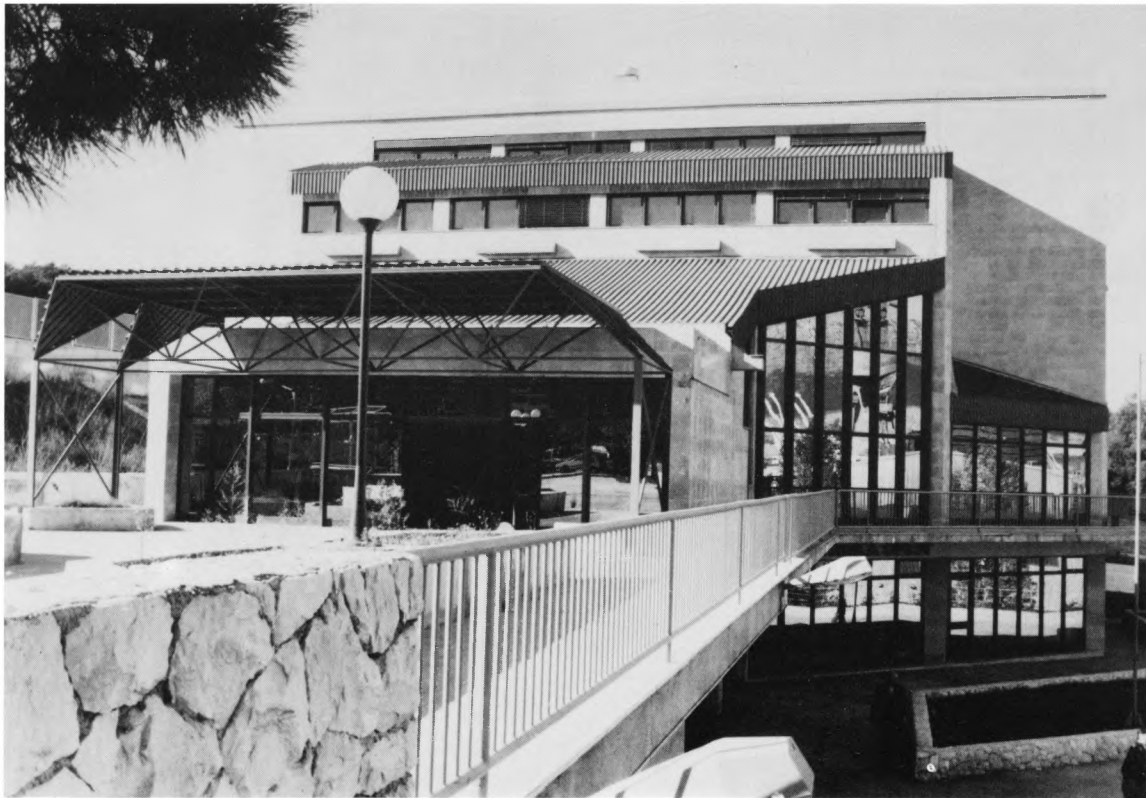
Muzej Brodosplit, Split – izgled zgrade

napravili odljeve, a neke smo sami izradili prema fotografijama ili crtežima iz literature (makete starih jedrenjaka, dijelove brodske opreme. . .).