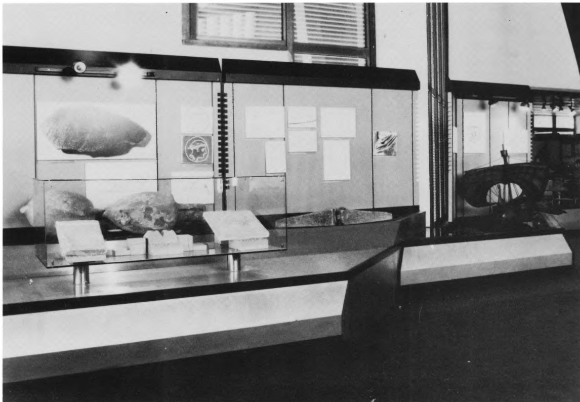
Muzej Brodosplit, Split – detalj stalnog postava