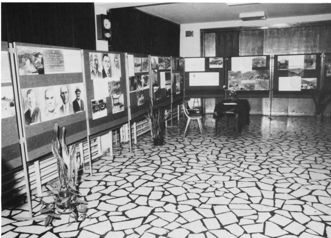
Postav izložbe Područje općine Kardeljevo između dvaju svjetskih ratova 1918–1939 (1986) u organizaciji Zavičajne zbirke općine Kardeljevo

Naša sredina, iako udaljena od većih kulturnih centara, ipak obiluje darovitim pojedincima, sada već dobro poznatih članova Likovne radionice iz