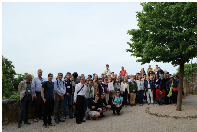
Slika 1 – Zajednička fotografija sudionika skupa, IMTB 2015, Mošćenice

Kongres IMTB 2015 okupio je sudionike iz različitih područja znanosti uključujući kemijsko inženjerstvo, strojarstvo, elektrotehniku, medicinu, farmaciju, kemiju, biokemiju, mikrobiolo-