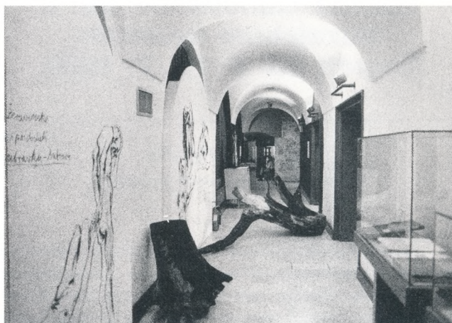
Postav izložbe Gundulićev san – na tragu Dubrave iz "Dubravke", Muzejski prostor, Zagreb

Prostorija s kosim podom-rampom također nije primjerena prostorna provokacija. Oslíkana je u plavo nebo i oblake, a po zidovima je crvenim grafitnim izrazom ispisan prekrasan stih iz Gundulićeve "Dubravke", stih "O lijepa, o draga, o slatka slobodo" 5 . Želje za kreiranjem bestežinskog stanja ostaju samo želje, jer praktična nesigurnost, zgrčenost i strah da se fizički ostane čitav konotiraju potpuno drugačiji smisao.