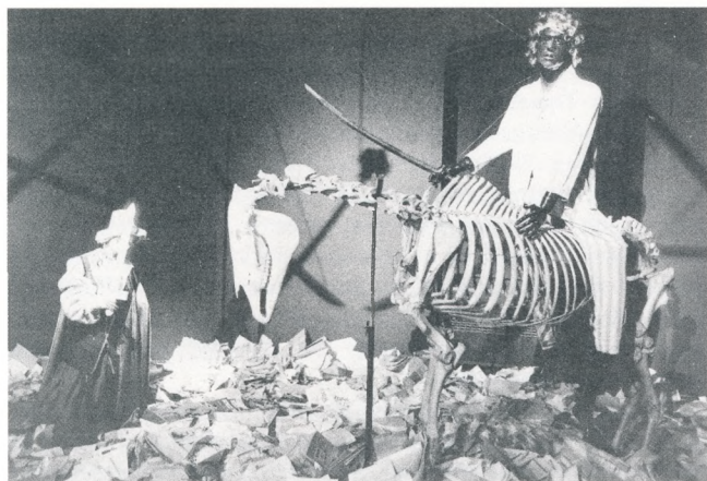
Postav izložbe Gundulićev san – vizualna prezentacija Hoćimske bitke iz "Osmana", Muzejski prostor, Zagreb

Prva prikazuje lutku Gundulića u poluležećem položaju, iza paralelno postavljene slike "Gundulićev san", a ispred ogledala i njena je impostacija prihvatljiva, iako je repeticijski odnos – Gundulić na slici, Gundulić na ležaju, Gundulić u ogledalu – vrlo problematičan. Međutim, detalj lica, tj. maske što se vidi u ogledalu, nagružuje i prizemljuje predodžbu, dokida tajnu, a uvodi neku novu horror-fantastiku.