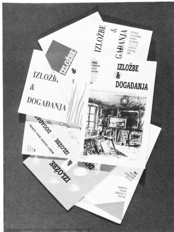
Publikacija »Izložbe i događanja«, design Borislav Ljubičić, u izdanju MDC-a, Zagreb Publications »Exhibitions and Events«, design Borislav Ljubičić, edited by the Museum Documentation Centre, Zagreb

Spomenut ćemo neke aktivnosti Muzejskog dokumentacionog centra kojima je cilj širenje muzeološke kulture i komunikacije. Centar je zamišljen kao ključna institucija unapređenja mnogovrsnih aktivnosti muzeja, a njegovo je djelovanje zadovoljavanje stručnih potreba muzeja i srodnih ustanova Hrvatske, djelomično i Jugoslavije. Muzejski dokumentacioni centar nastoji djelovati kao središnji stručni operativni punkt muzeja.