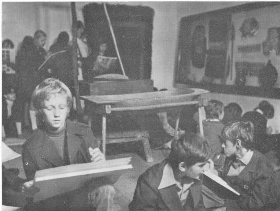
Djeca crtaju predmete iz etnografske zbirke Gradskog muzeja Karlovac, 1975. god.

Naslovna strana kataloga Gradskog muzeja Karlovac, Galerije »Vjekoslav Karas« izložbe Moj grad olovkom i bojom