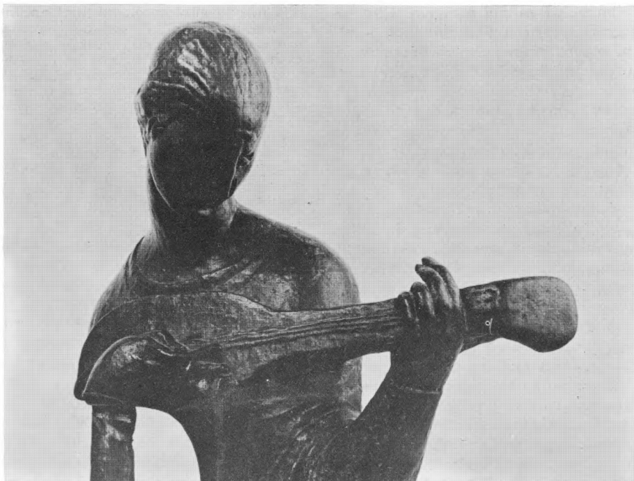
Ivan Meštrović, Djevojka s lutnjom. Snimio: G. Vukov-Colić

ča na toj izložbi. Potvrđeno je da su posjetioци željni dodatnih informacija o eksponatima (mimo kataloga) – osobito oni koji su neumjetničkih zanimanja. O karakteru poželjnih informacija nema baš jasnih odgovora (očekuje se od nas da pružimo alternative), ali manje-više svi žele neka pojašnjenja u pogledu vrednovanja radova i načina njihovog promatranja. To je potvrdilo naš stav da je u posjetilaca najvažnije razvijati pristup umjetničkom radu umjesto gomilanja činjenica oko njega.