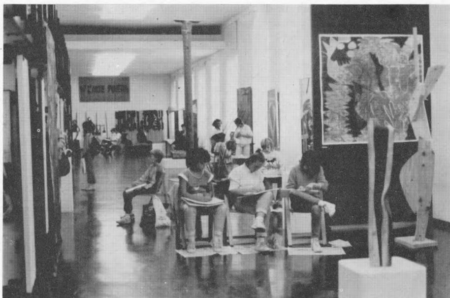
Akcija Djeca o izložbi-izložbom u Modernoj galeriji Rijeka

Posljednjih tjedana održavanja izložbe 14. biennale mladih jugoslavenskih umjetnika u riječkoj Modernoj galeriji bilo je neobično živo. Osmoškolci su se satima zadržavali na izložbi (neobično) – crtajući, trgajući, lijepeći (živo!). Pasteli, olovke u boji, kolaž – papir... Vrlo je teško djecu tog uzrasta voditi izložbom na uobičajeni način. Njihova pažnja traje kratko i brzo prelazi na okolne objekte. Raspršuju se i svako dijete traži »svoju« sliku ili skulpturu, formiraju se male debatne grupe iz kojih pljušte upiti nastavniku ili vodiču. Ali, sve to ne traje dugo. Zapravo oni »pretrče« izložbom. Kako ih barem malo zaustaviti?