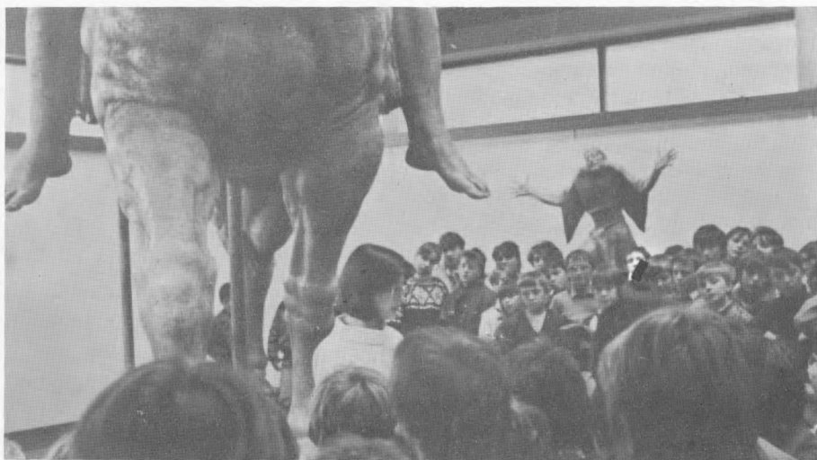
Sa školskog sata u Galeriji »Antuna Augustinčića« u Klanjcu – predavanje na temu Spomenik miru, 1984. god.

Ovaj je cilj svakako najvažniji u radu s djecom jer oni brzo stječu znanje, ali isto tako brzo zaboravljaju činjenice i