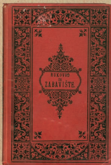
Rukovođ za zabavište Antonije Cvijić