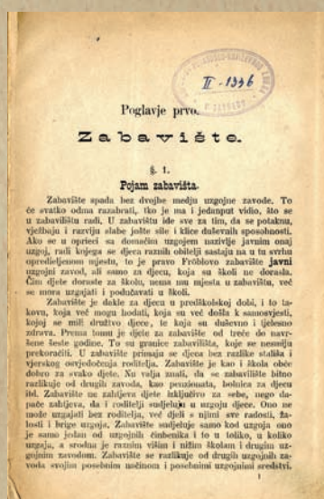
Teorija zabavišta nepoznatog autora