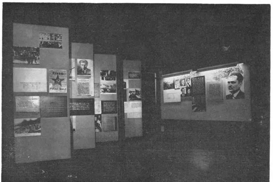
Detalj iz stalnog, starog, postava Muzeja revolucije naroda Hrvatske u Zagrebu