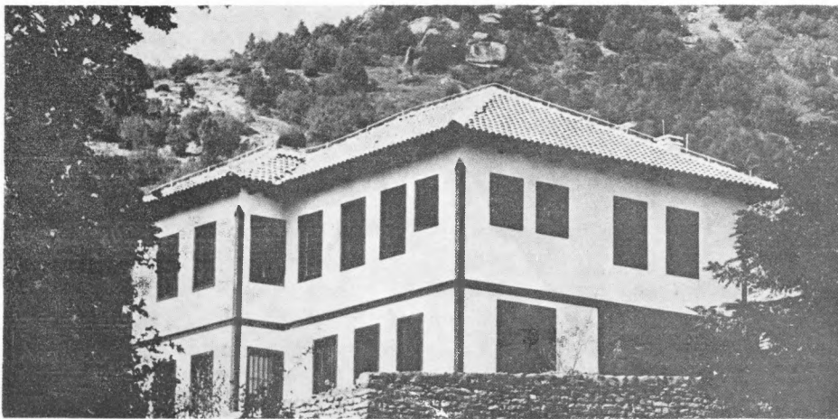
Memorijalni muzej Glavni štab NOP-a i PO u Makedoniji

operacija za konačno oslobođenje Makedonije i cijele Jugoslavije ali, isto tako, i iz praktičnog uspostavljanja svih funkcija već konstituirane makedonske državnosti u okvirima bratske zajednice jugoslovenskih naroda.