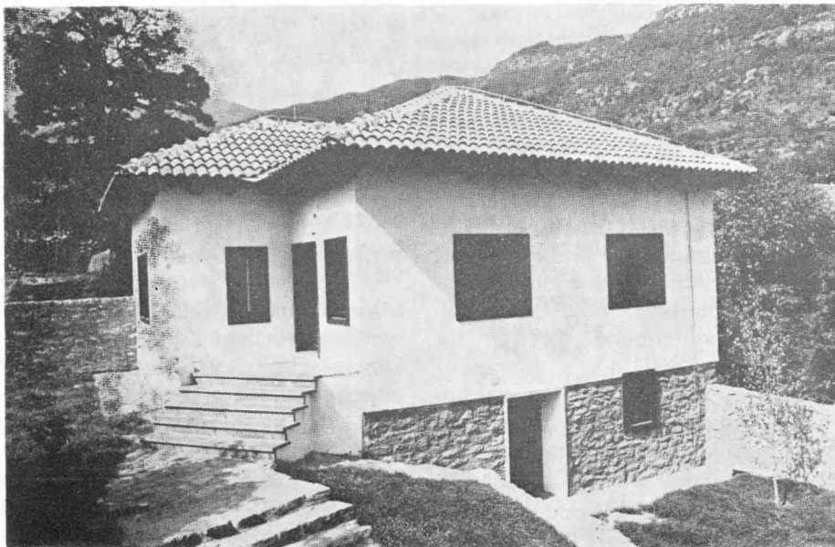
Memorijalni muzej »Partizanska štamparija Goce Delčev«

Kako bi ovaj muzejski kompleks mogao da ispuni svoju osnovnu odgojnu-obrazovnu funkciju u nje-