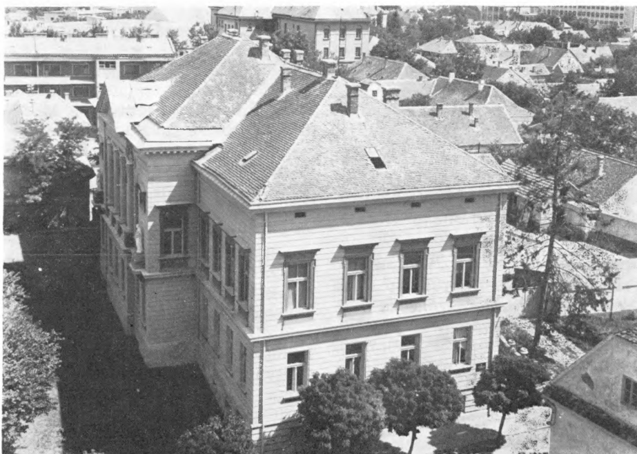
Zgrada bivšeg Okružnog suda u Sremskoj Mitrovici u kojoj je danas Muzej revolucije i socijalističke izgradnje

lja, posvećen streljanim žrtvama u drugom svetskom ratu, arhitekta Bogdan Bogdanović dao je predlog da se u okviru kompleksa izgradi i nova muzejska zgrada. Nemogućnost obezbeđenja finansijskih sredstava uputila je na drugo rešenje, u potkrovlju postojećeg Muzeja stare zgrade porodice Bajić. Ali, kako se objekt nalazi u samom centru grada, nije se mogao naći odgovarajući plan za pristup i obezbeđenje izložbenog pa i pratećeg muzejskog prostora. Treći pokušaj projektanti su dali u vidu rekonstrukcije stare mitrovačke gimnazije, nastale u prošlom ve-