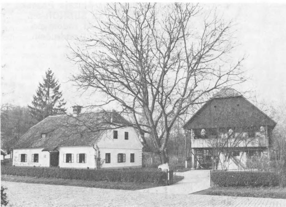
Rodna kuća Josipa Broza Tita i gospodarski objekt obitelji Broz u Kumrovcu

Na tradicijama »Slobodne Vojvodine« izrasli su današnji dnevni listovi Socijalističkog saveza SAP Vojvodine: »Dnevnik« na srpsko-hrvatskom jeziku, i »Magyar szo« (Glas naroda) na mađarskom, »Libertatea« (Sloboda) na rumunjskom, i »Ruske slovo« (Rusinska reč) na rusinskom jeziku, koji na istoj revolucionarnoj liniji vode idejno-političku bitku za samoupravne socijalističke društvene odnose i neguju bratstvo-jedinstvo ravnopravnih naroda i narodnosti u stvarno slobodnoj Vojvodini.