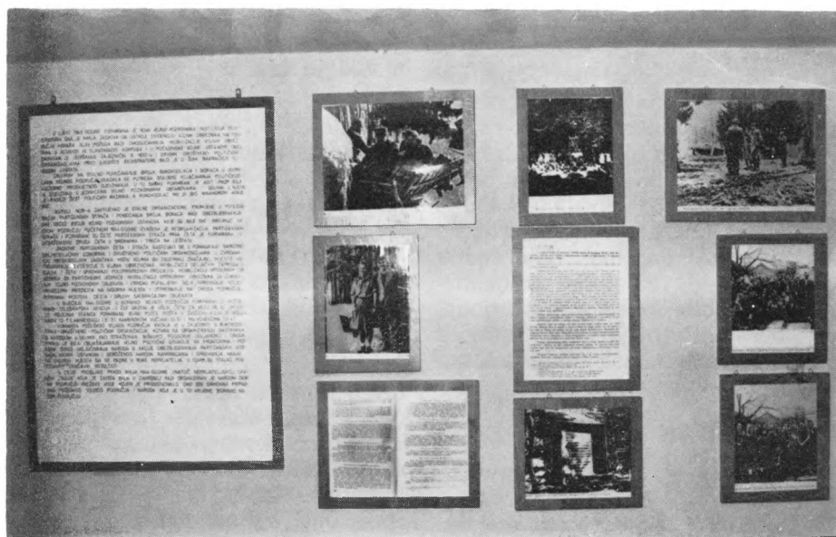
Detalj spomen-sobe Požeškom vojnom području u društvenoj prostoriji OO Kooperanata u Velikoj