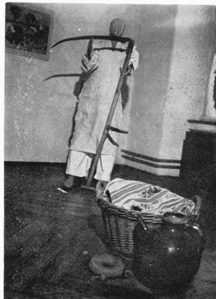
Detalj s izložbe Nošnje samoborskog kraja u Samoborskom muzeju, II. soba

katalogom. Usprkos neznatno uložnim sredstvima (što se najzornije očitovalo u preskromnoj muzeografskoj obradi izložbe) ali zato jasnim i značajkim odnosom prema materijalu i nedvojbenim smislom za muzejsku priču postignuti su rezultati koji znatno nadrastaju mnogo razvikanije muzejske projekte. Ponajprije, jedna od najvažnijih karakteristika muzejske izložbe je muzejska priča, poruka, njena čitljivost i smisao za cjelinu, zaokruženost. Tako je gledaocu ove izlo-