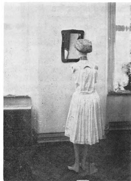
Detalj s izložbe Nošnje samoborskog kraja u Samoborskom muzeju, I. soba

Da ima pomaka i da se može i drukčije i — tvrdim — bolje, pokazala je izložba gotovo banalnog naslova, Narodne nošnje Samoborskog kraja u Samoborskom muzeju, koja, nažalost nije popraćena