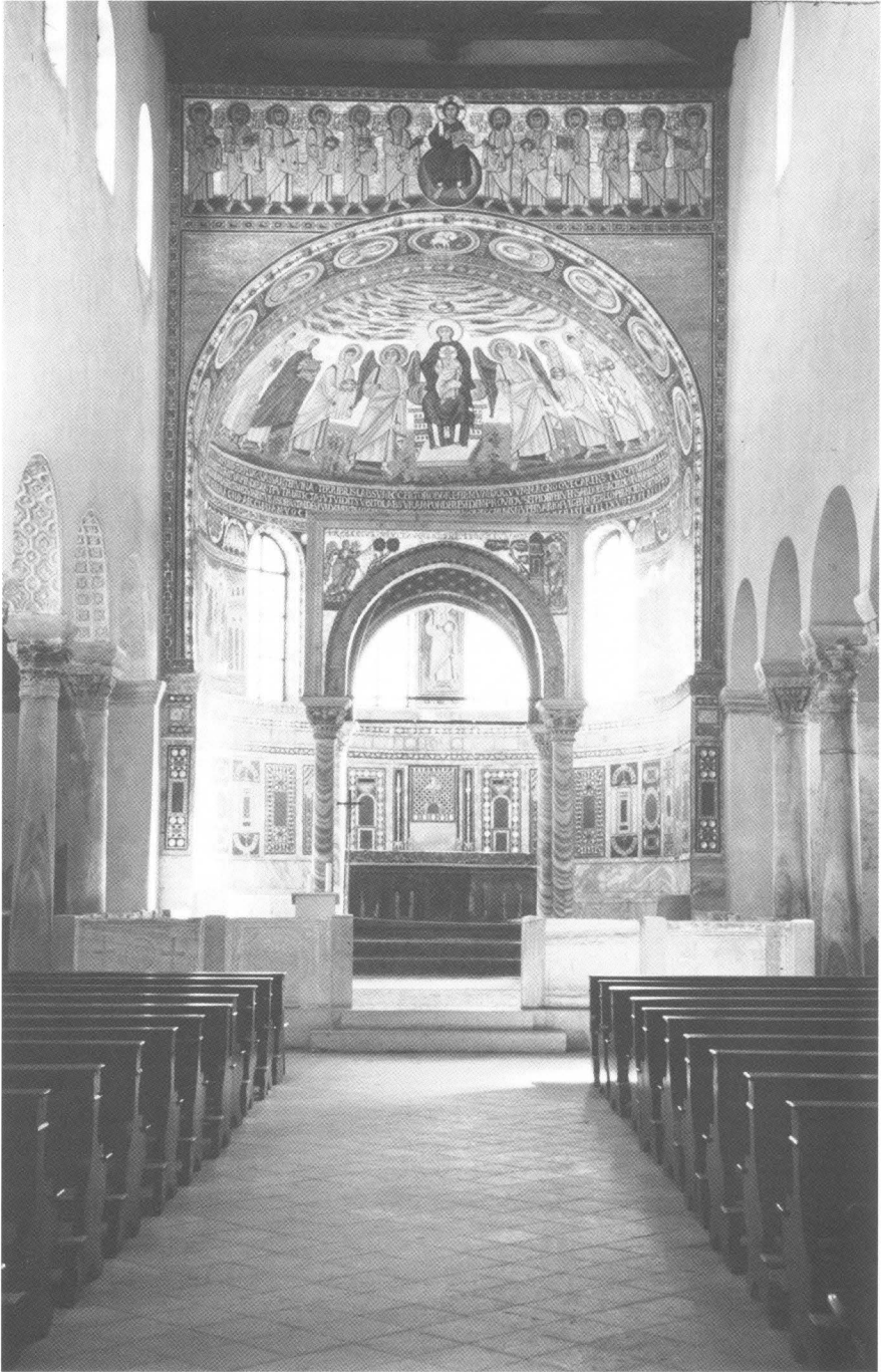
Unutrašnjost Eufrazijeve bazilike u Poreču, VI. st.