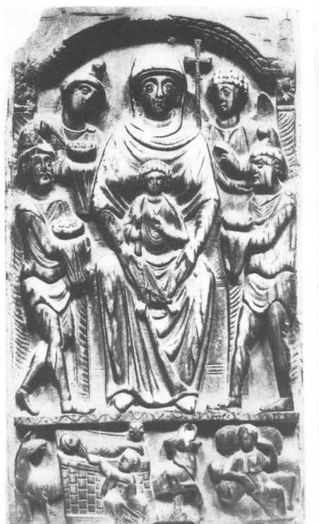
Središnji dio diptiha, VI. st., London, British Museum