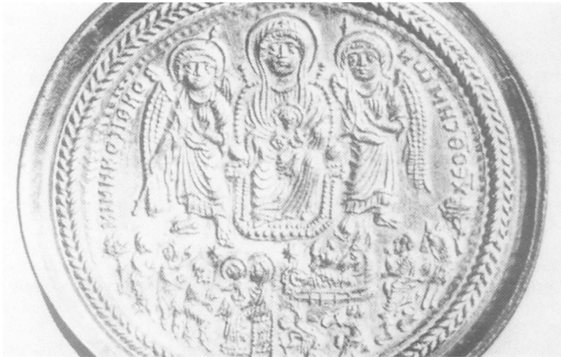
Zlatni enkolpion s likom Bogorodice i scenama Rodenja i Poklonstva kraljeva, druga polovica VI. st. (?), Dumbarton Oaks Collection

ikonografski model Bogorodice već bio prisutan u Konstantinopolu gdje se s njim mogao upoznati i budući ostrogotski kralj i vladar Italije Teodorik koji je u to vrijeme kao talac boravio na carskom dvoru. Razdoblju njegove vladavine u Raveni se, naime, pripisuje dio mozaika u crkvi S. Apollinare Nuovo koji prikazuje Mariju s Djetetom u krilu, okruženu anđelima, na bočnom zidu glavnog broda. 20