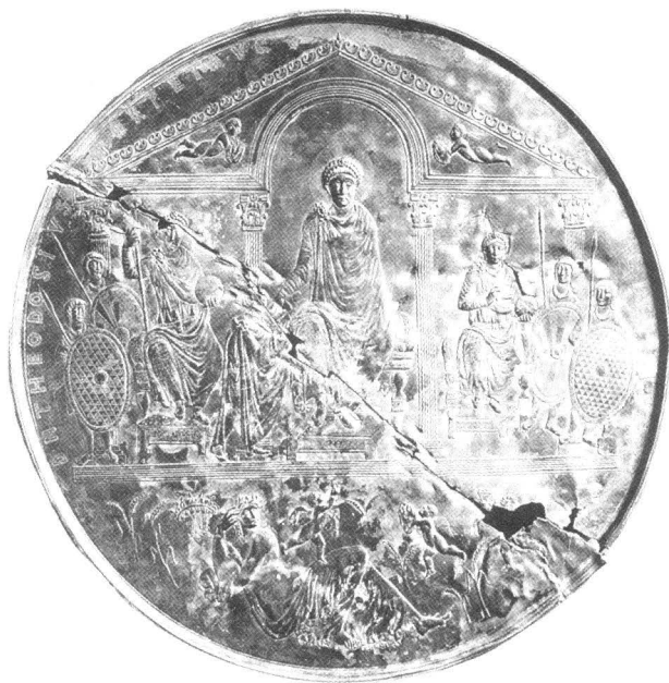
Srebrni misorij cara Teodozija I, kraj IV. st., Madrid, Accademia de la Historia

razdoblja koje nesumnjivo naginje duhovnosti ( Age of Spirituality )? 7 Prvotni likovni izraz kršćana bio je ponajprije izraz pobožnosti i relativno difuznih uvjerenja kršćanskog društva u nastajanju, a manje službene politike Crkve. Kršćanski carevi (od Konstantina nadalje) nastavljaju se koristiti ustaljenom carskom ikonografijom koja ne pokazuje bitnih promjena u odnosu na prethodno razdoblje i koja je sve do kraja 4. st. lišena eksplicitnih vjerskih obilježja. Ali, između ovog ranog razdoblja, kada je kršćanska umjetnost skoro isključivo vezana uz zagrobni kontekst i "dekor koji okružuje smrt" (katakombe i sarkofazi) 8 i doba Justinijana, puno se toga promijenilo. Od druge polovice 4. st., kada započinje ukrašavanje velikih gradskih bazilika u Rimu (npr. sv. Petra ili sv. Pavla izvan zidina) i drugim središtima carstva, ikonografski program novih svetišta počinje oslikavati kršćanski ustroj svemira, pri čemu su sve prisutniji utjecaj teologa i elementi carske ikonografije koji pridonose likovnom izrazu trijumfa Crkve.