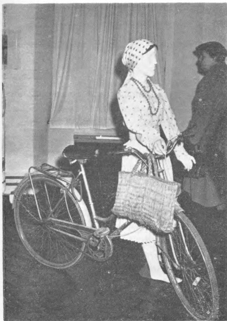
Detalj s izložbe Nošnje samoborskog kraja u Samoborskom muzeju, III. soba

žbe odmah jasno da će se narodne nošnja, odnosno odijevanje, pratiti kroz transformacije, koje donosi vrijeme, i kroz prilike, odnosno funkcije životnih sadržaja. Prva prostorija opremljena je tako da nas uvodi u svečane trenutke sela — vjenčanje, crkvena procesija i sahrana. Svečano prostiranjem stolom u kutu sobe ostvaren je ugođaj kućnih slavlja, dok su fotografijama scena na otvorenom dočarani vanjski sadržaji. Narodne su nošnje prikazane na lutkama, prebačene preko škrinja za spremanje nošnji i postavljene na zid uz fotografije prikladnih sadržaja. Rekonstrukcija