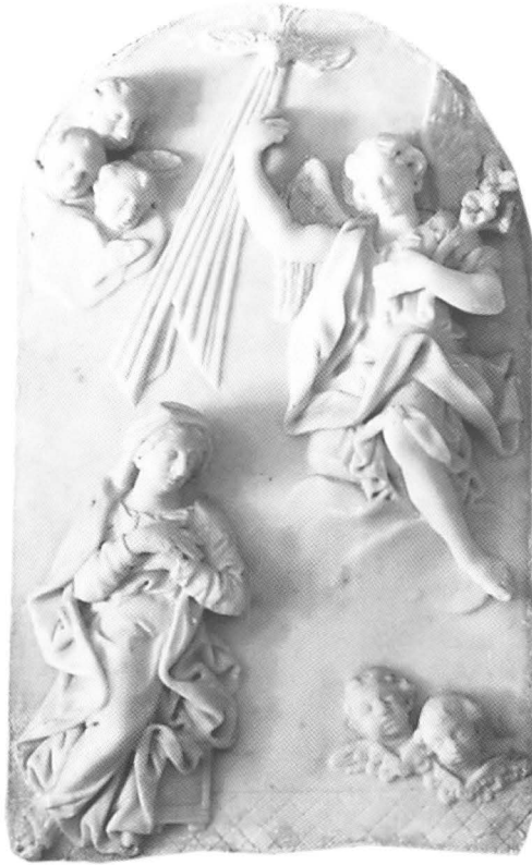
Mletački kipar, Navještenje, Perast, svetište Gospe od Škrpjela

Mateja koju je Giovanni Bonazza potpisao. 23 Uspoređivao se i terakotni reljef »Navještenja« koji se nekada nalazio kod venecijanskoga trgovca Pippa Caselattija koji se također pripisivao Giovanniju Bonazzi. 24