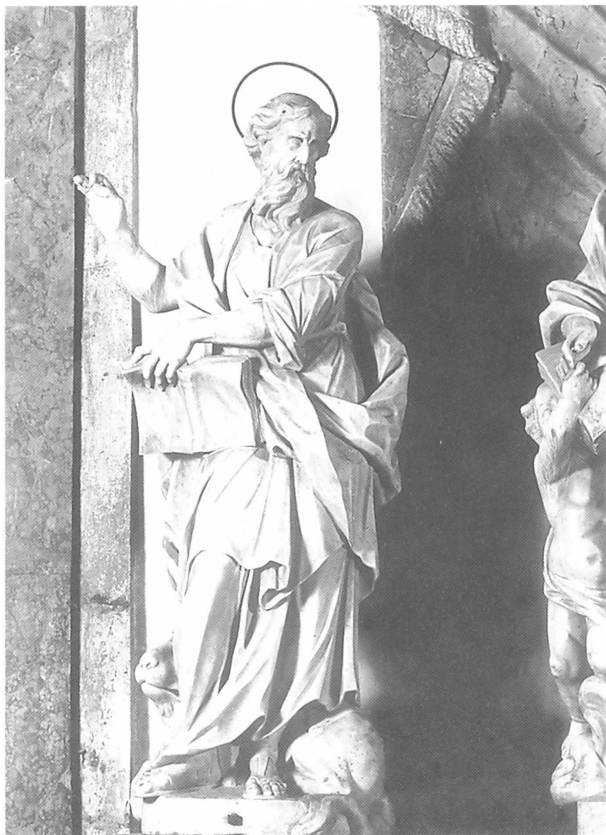
Francesco Cabianca (atrib.), Sv. Marko, Zadar, katedrala, Oltar Presvetog Sakramenta