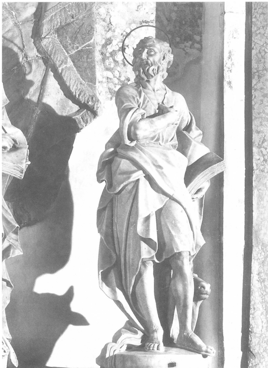
Francesco Cabianca (atrib.), Sv. Luka, Zadar, katedrala, Oltar Presvetog Sakramenta