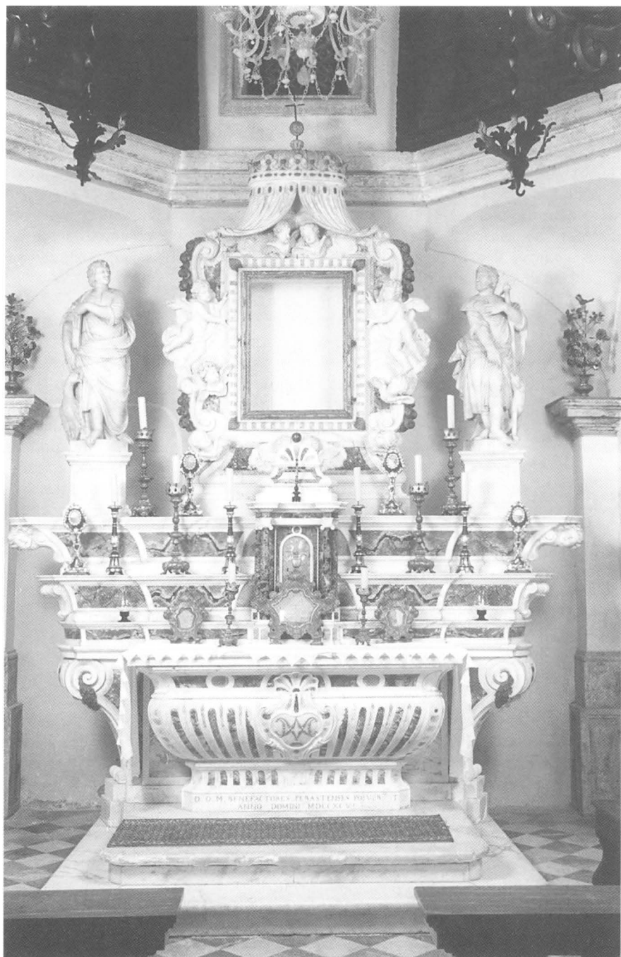
Antonio i Gerolamo Capellano-Francesco Gai, Oltar Gospe od Škrpjela, Perast, crkva Gospe od Škrpjela