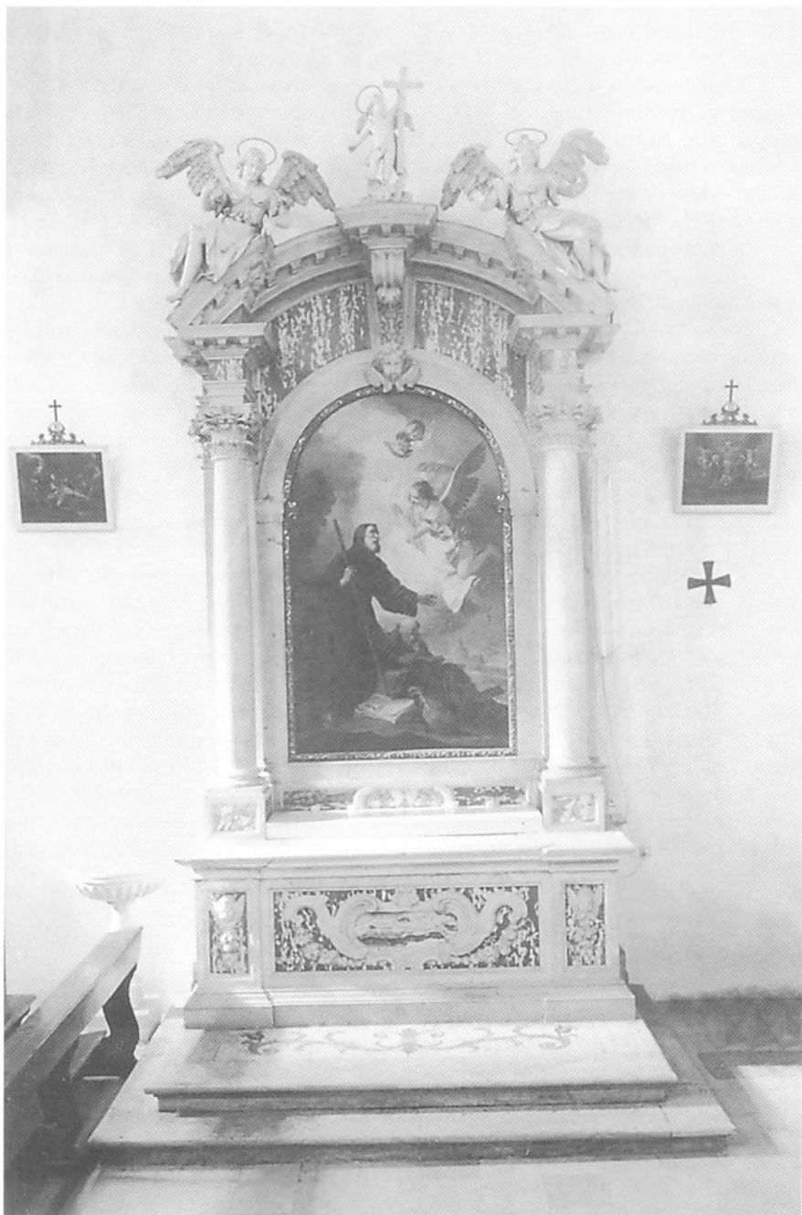
Radionica Francesca Cabianke (Maffio Torresini ?), Oltar sv. Frane Paulskog, Kotor, crkva sv. Klare