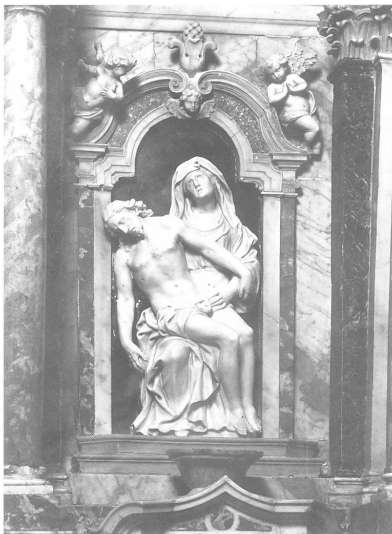
Francesco Cabianca (atrib.), Pietà, Zadar, katedrala, Oltar Presvetog Sakramenta