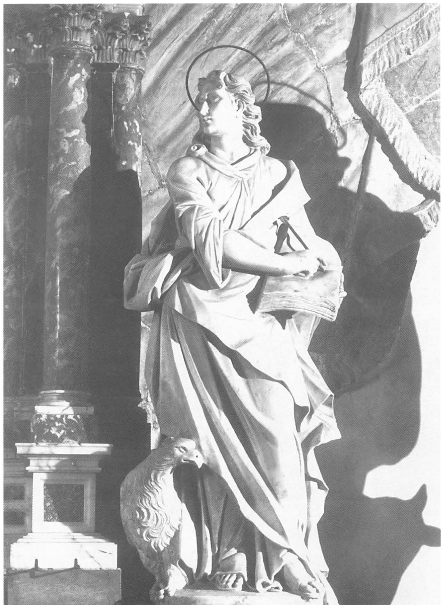
Francesco Cabianca (atrib.), Sv. Ivan, Zadar, katedrala, Oltar Presvetog Sakramenta