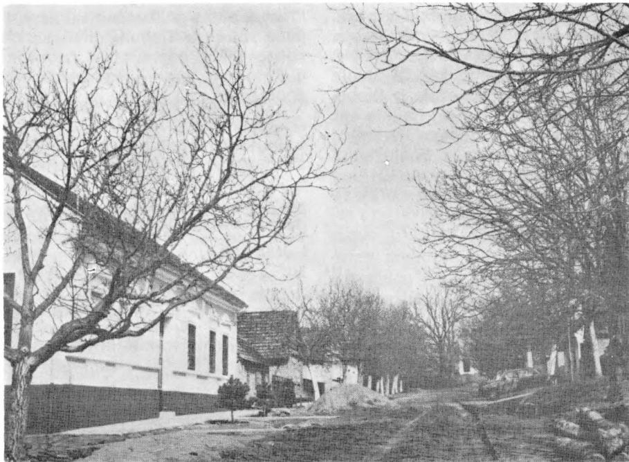
Zgrada u kojoj je Memorijalna zbirka Kindrovo u Kindrovu

dokumenti, legende, grafikoni, karte. Tu se nalazi i manji broj trodimenzionalnih eksponata, oružja i dijelova partizanske opreme i originalni brošura i letaka iz fundusa Muzeja. Plošni eksponati kaširani su na panoe, fotoplatnima su popunjene prozorske površine a trodimenzionalni predmeti postavljeni u tri manje staklom zaštićene vitrine. Poseban vizualni akcent izložbi daju panoji, njihov dizajn koji izlazi iz okvira klasičnog i uobičajenog za postavljanje ovakvih muzejskih izložbi. Većih dimenzija i različitog oblika, panoji potenciraju monumentalnost i dinamičnost. Autor likovnog rješenja, dakle i dizajna panoa, dugogodišnji je suradnik ovog Muzeja, Frane Delalle, akademski slikar iz Beograda.